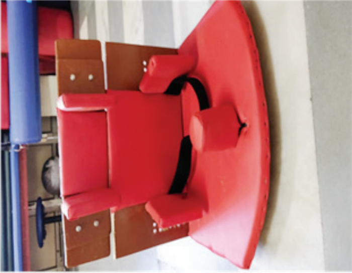
மூளை முடக்குவாத குழந்தைகளுக்கான சிறப்பு நாற்காலி