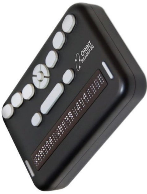
மின்னணு வடிவில் உள்ள புத்தகங்களை பிரெய்லி எழுத்துக்கள் வடிவில் தொடு உணர்வுடன் அறிய உதவும் வாசிக்கும் கருவி