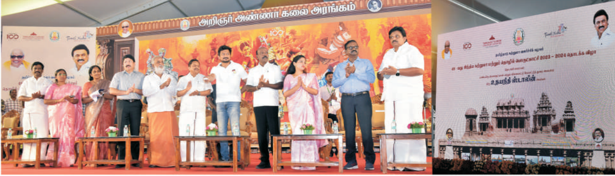
சென்னை, தீவுத்திடல், அண்ணா கலையரங்கில், 12.01.2024 அன்று 48-வது இந்திய சுற்றுலா மற்றும் தொழில் பொருட்காட்சியை மாண்புமிகு இளைஞர் நலன் மற்றும் விளையாட்டு மேம்பாட்டுத்துறை அமைச்சர் திரு.உதயநிதி ஸ்டாலின் அவர்கள் தொடங்கி வைத்தார்கள்.