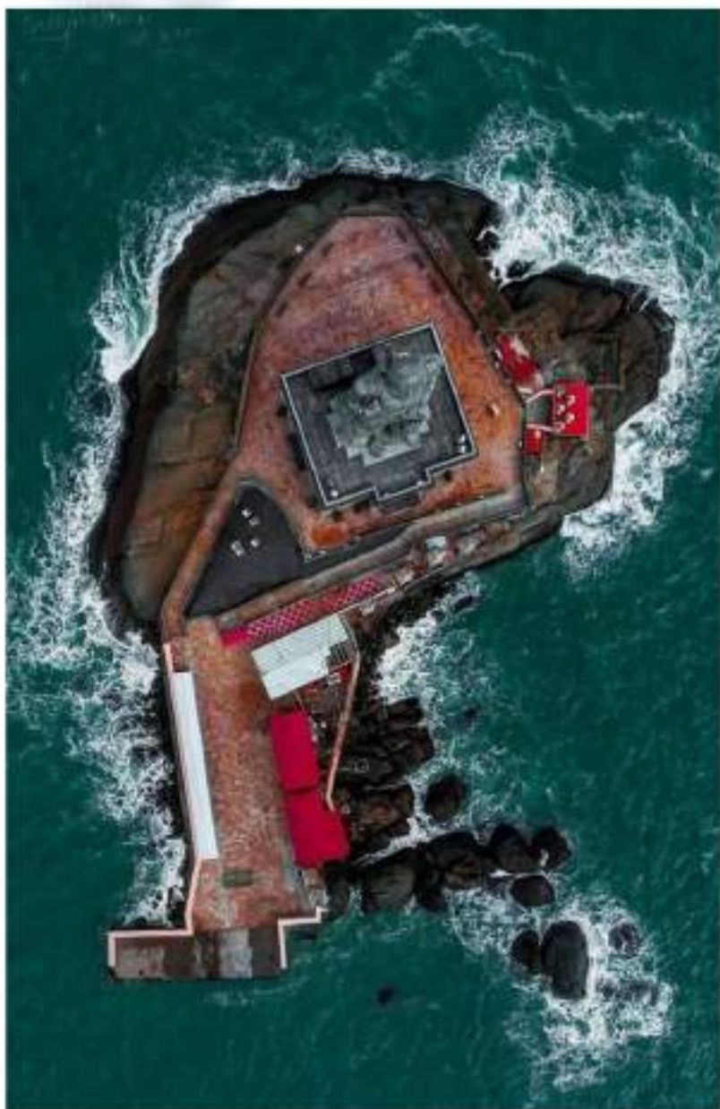
அய்யன் திருவள்ளுவர் சிலை - கன்னியாகுமரி