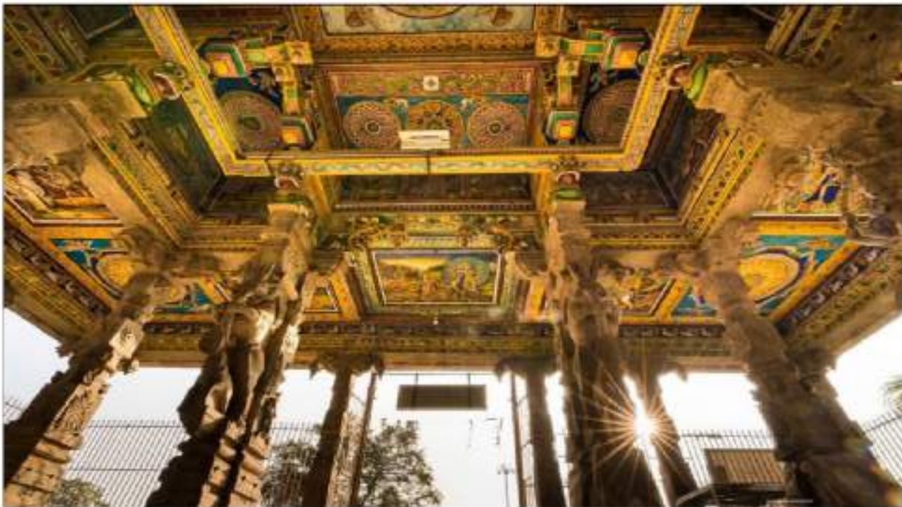
மேற்கூரை ஓவியம் - அருள்மிகு ஆட்கொண்டநாதர் திருக்கோயில், இரணியூர், சிவகங்கை.