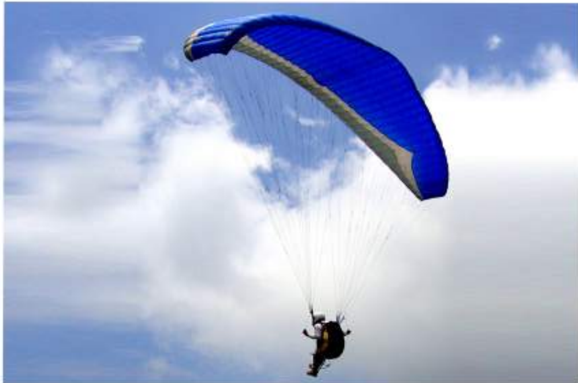
சாகச கற்றுலா - பாராகிளைடிங், ஏலகிரி