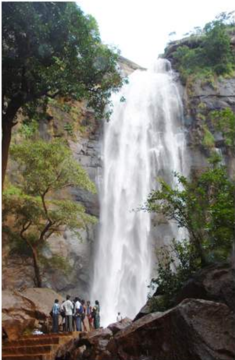
ஆகாச கங்கை நீர்வீழ்ச்சி - கொல்லி மலை