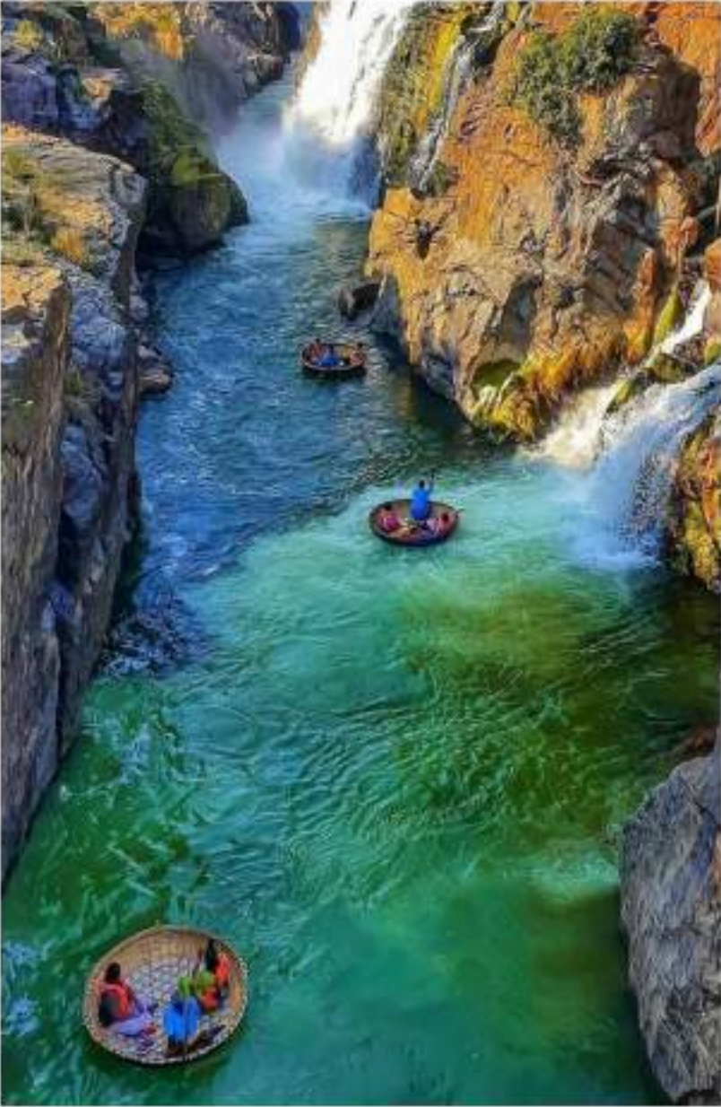
இயற்கை சுற்றுலா - ஒகேனக்கல் அருவி