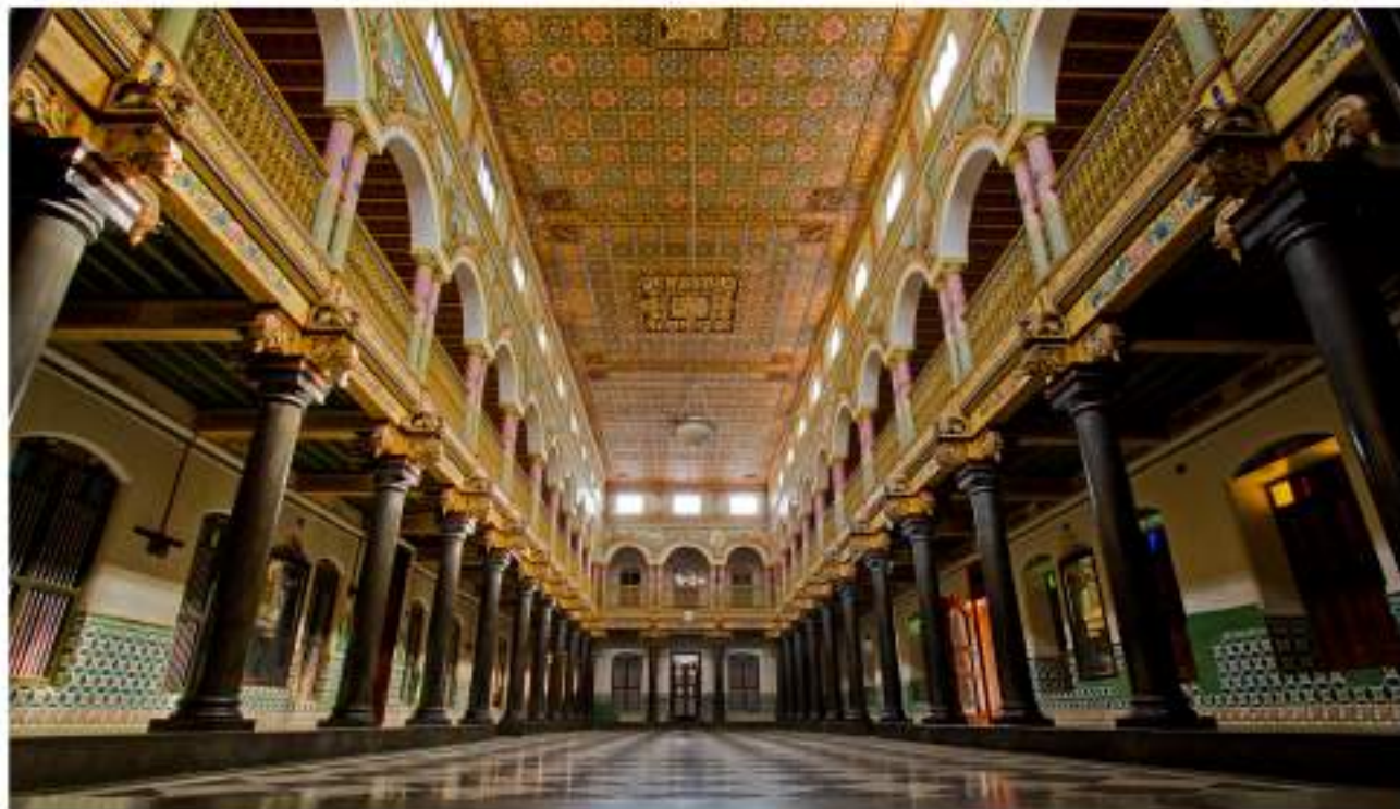
பாரம்பரிய சுற்றுலா - செட்டிநாடு, சிவகங்கை.