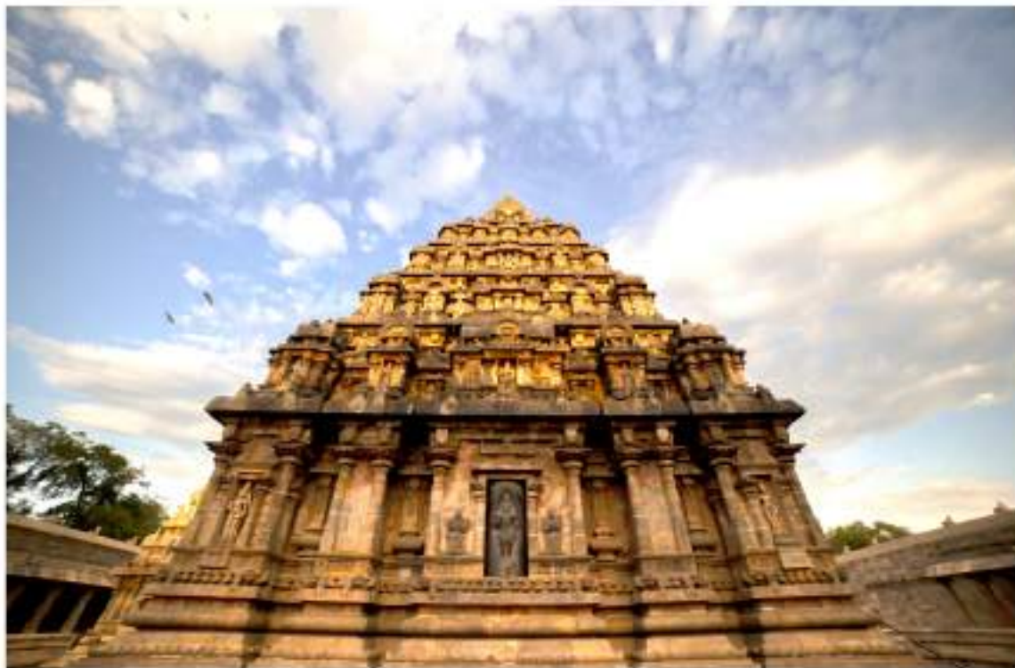
பாரம்பரிய / ஆன்மீக சுற்றுலா – ஐராவதீஸ்வரர் கோயில், தாராகரம்