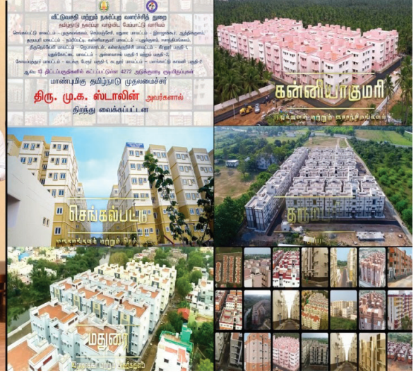
மாண்புமிகு தமிழ்நாடு முதலமைச்சர் அவர்கள் கடந்த மூன்றாண்டுகளில் தமிழ்நாடு நகர்ப்புற வாழ்விட மேம்பாட்டு வாரியத்தால் 96 திட்டப்பகுதிகளில் ரூ.3248.74 கோடி மதிப்பீட்டில் கட்டப்பட்ட 29,439 அடுக்குமாடிக் குடியிருப்புகளை திறந்து வைத்தார்கள்.