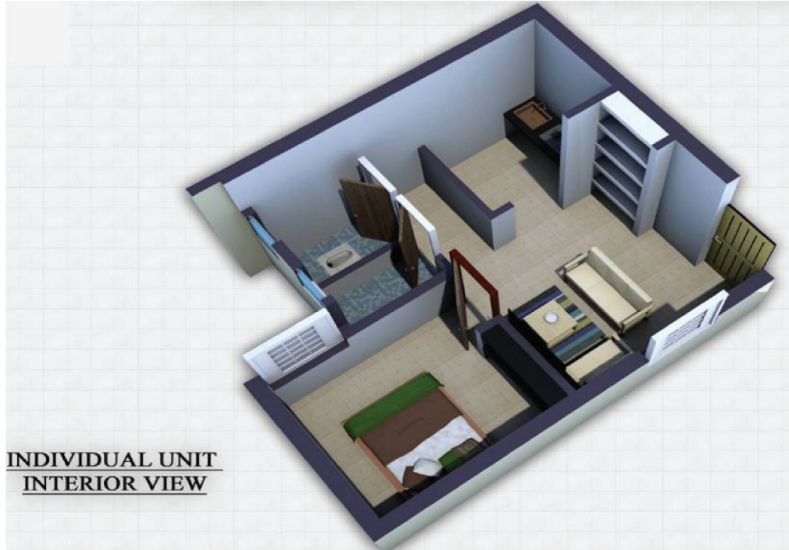
இணைப்பு - II