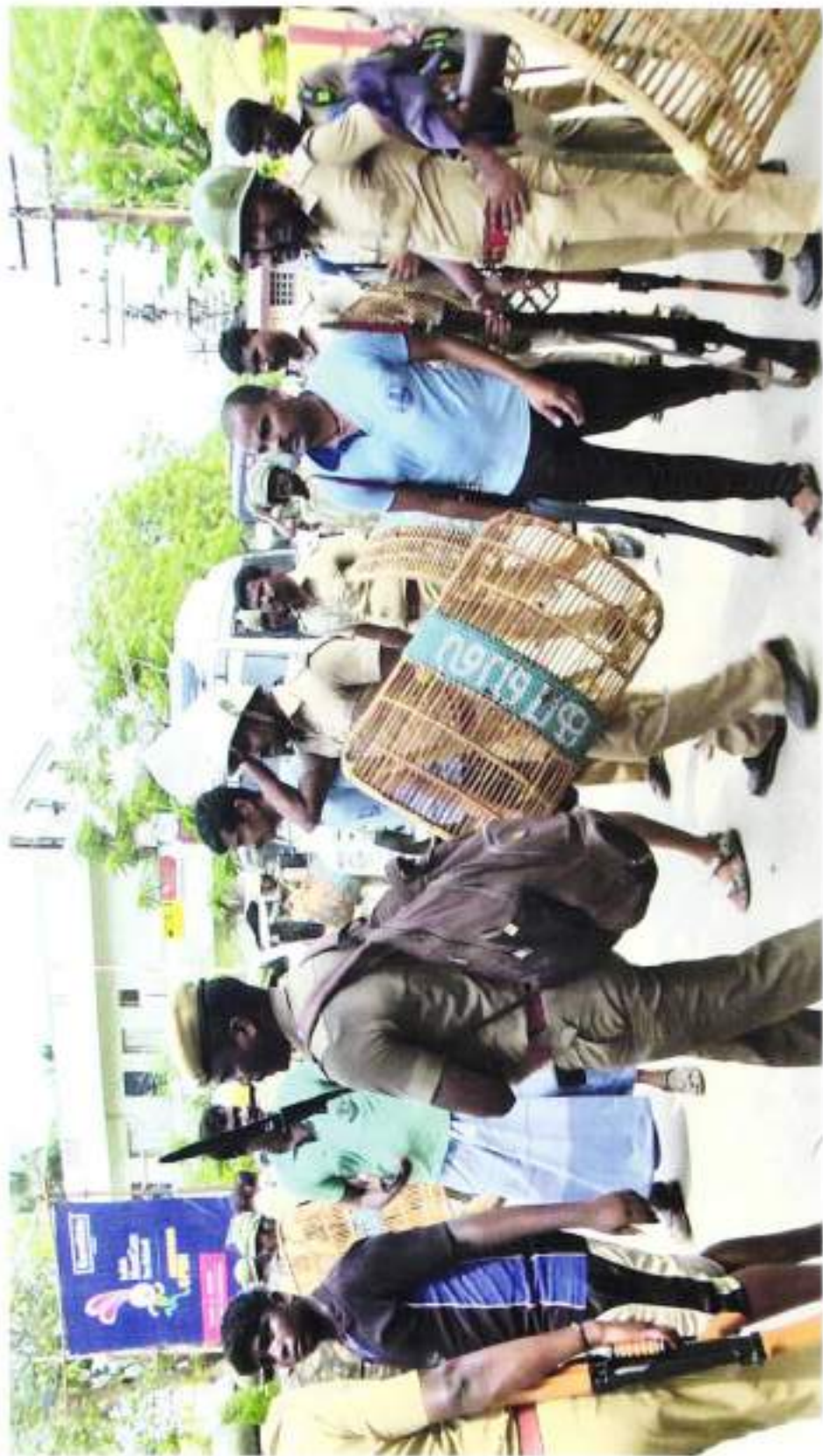
UN UNIFORMED POLICE PERSONNEL WITH RIFLE