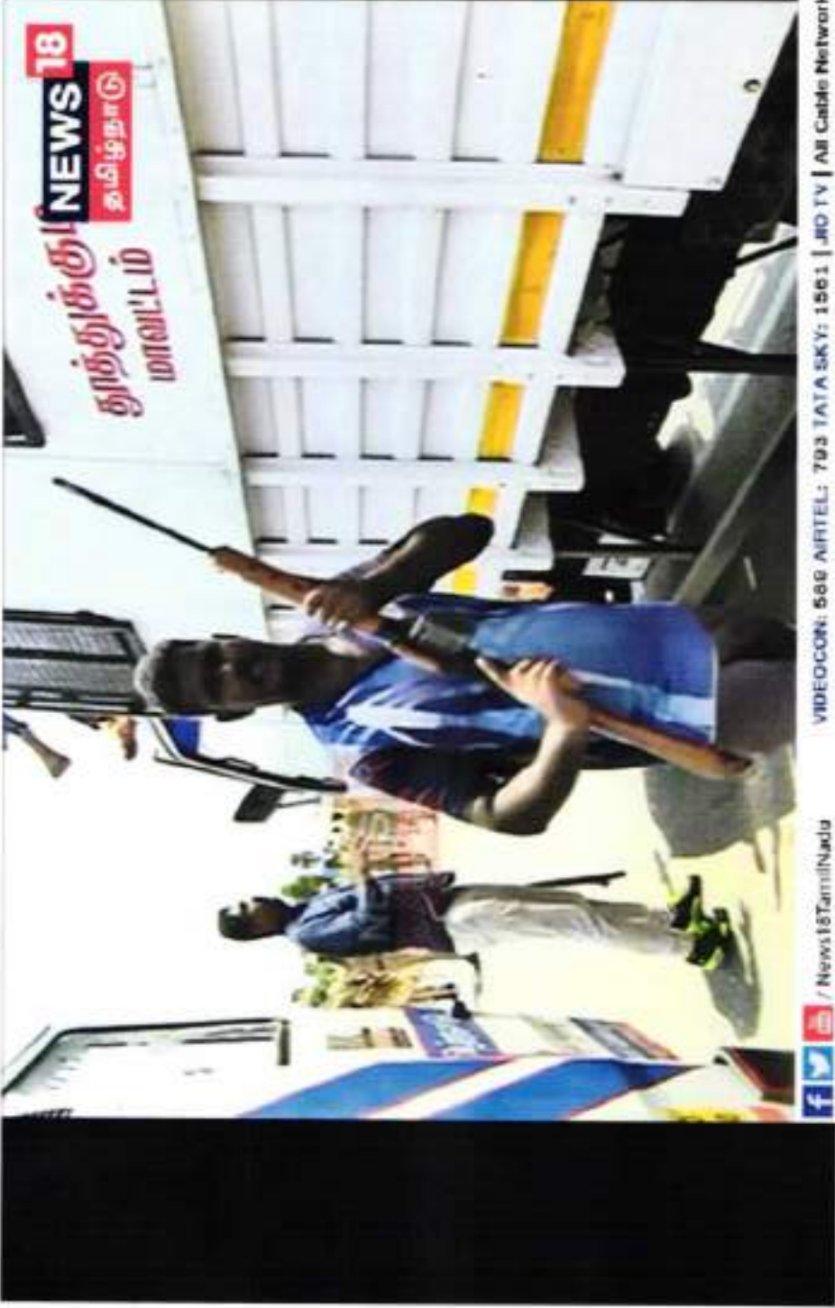
POLICE NOT IN UNIFORM