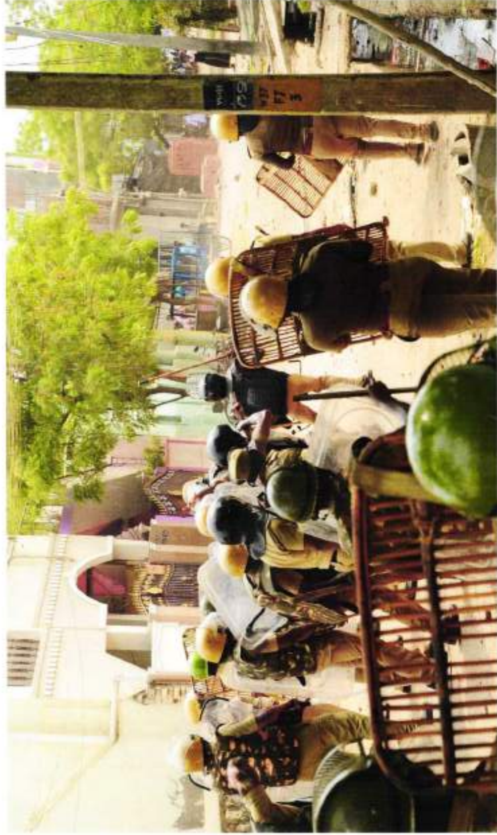
POLICE TARGETTING PROTESTERS IN ANNA NAGAR BEFORE KALIYAPPAN GOT INJURED