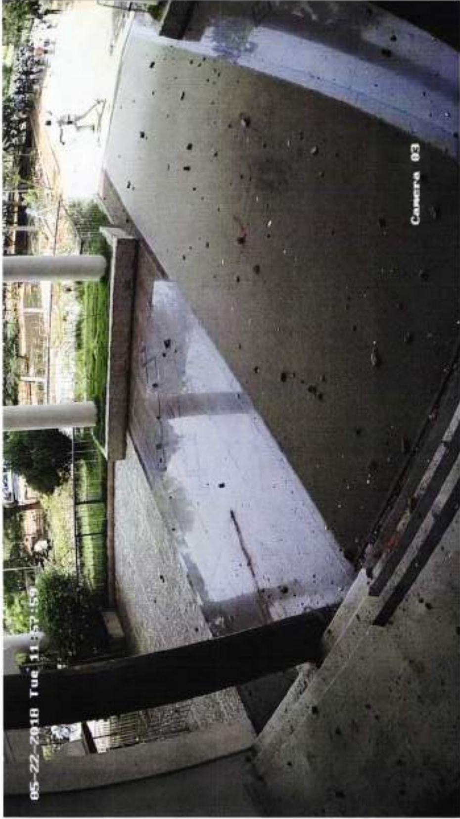
REENIS WITH PISTOL NEAR PROTICO