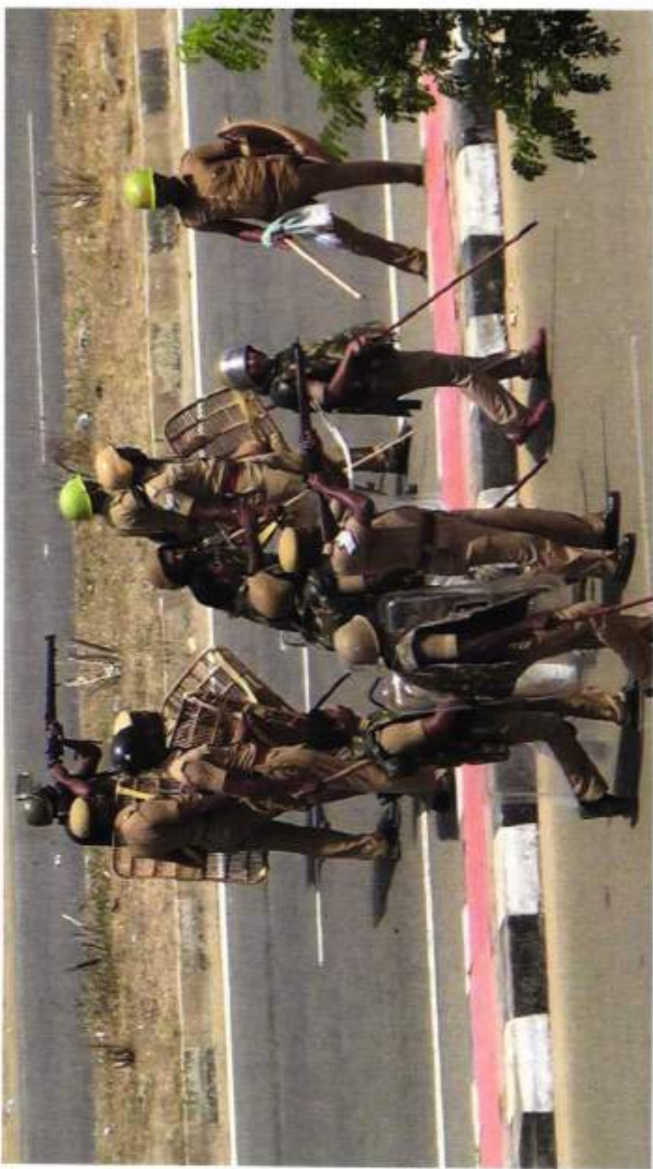
TWO POLICE PERSONNEL IN GUN WITH DIG