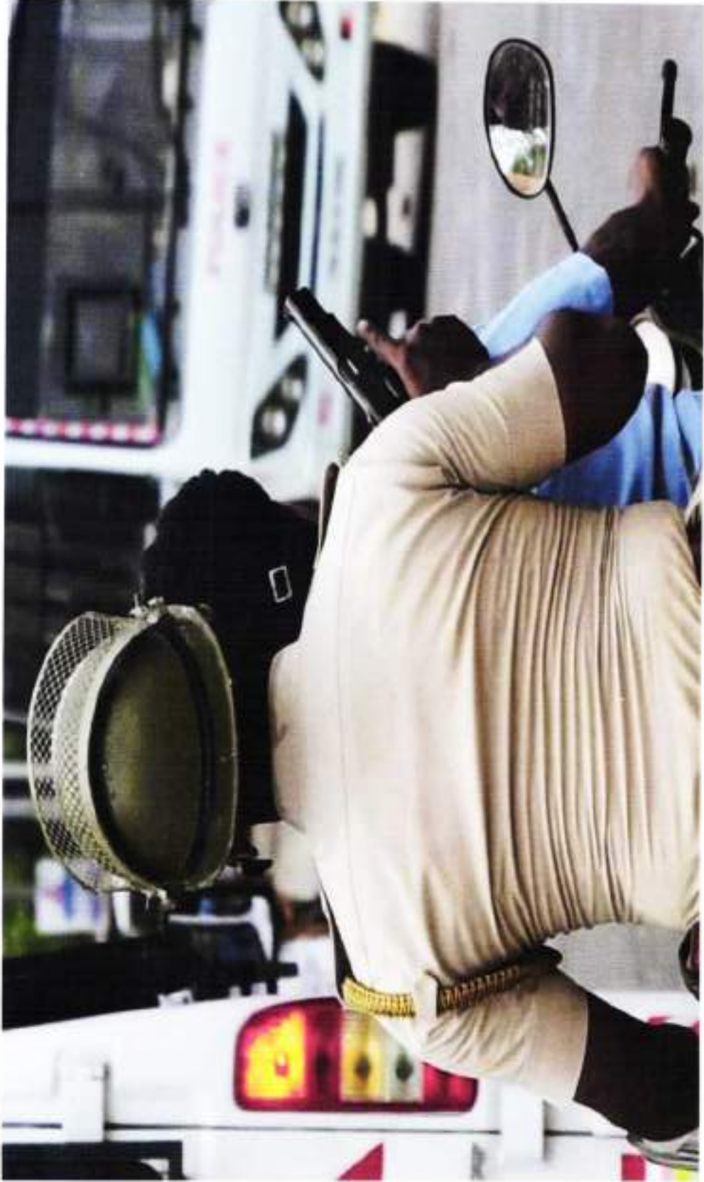
SUN INSPECTOR IN PILLION WITH PISTOL