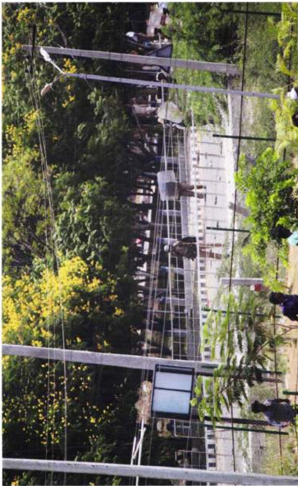
POLICE SHOOTING INSIDE COLLECORATE (PROTESTERS ARE SCATTERED)