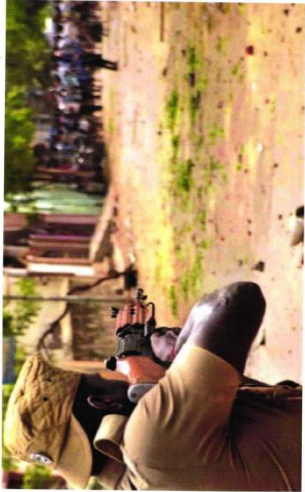
ANNA NAGAR – PC MATHIVANA SHOOTING UNDER ORDERS OF SP THOOTHUKUDI MAHENDREN WITH SLR