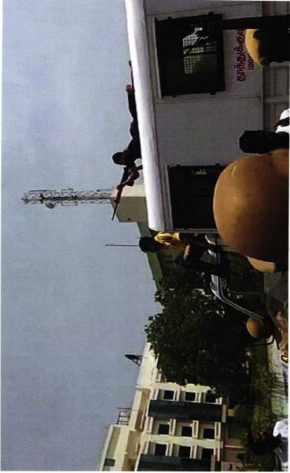
HC RAJA AND PC MURUGAN IN UN UNIFORM ON TOP OF VAN WITH SLR