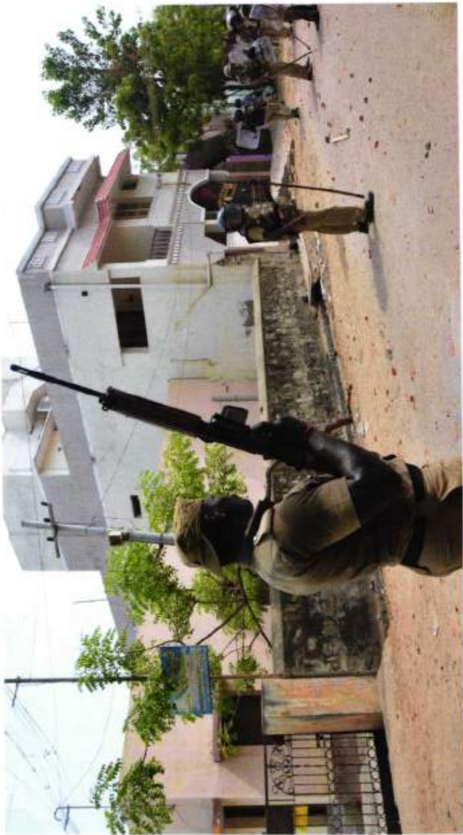
PC MATIVANAN WITH SLR IN ANNA NAGAR