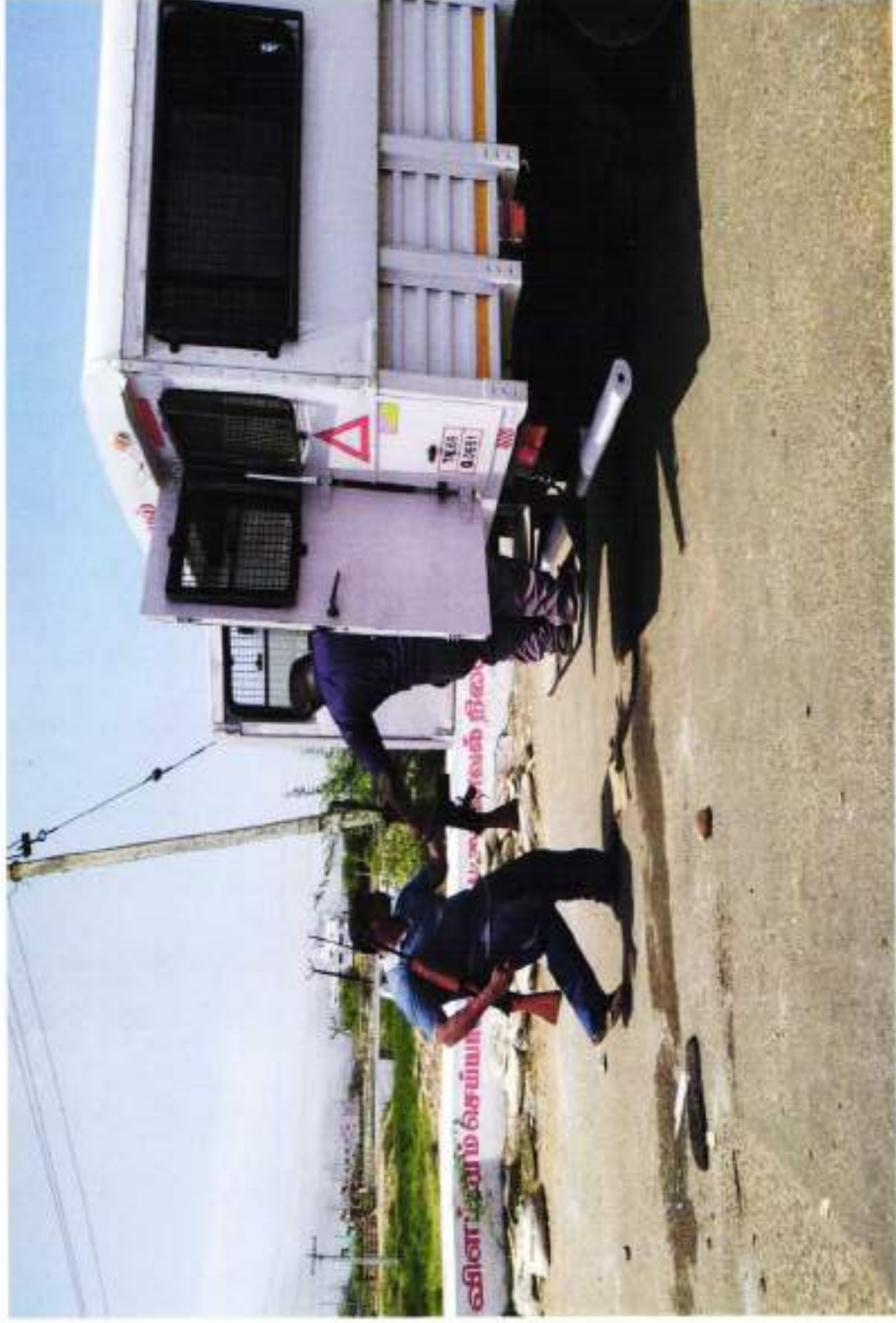
POLICE PERSONNEL NOT IN UNIFORM WITH RIFLE