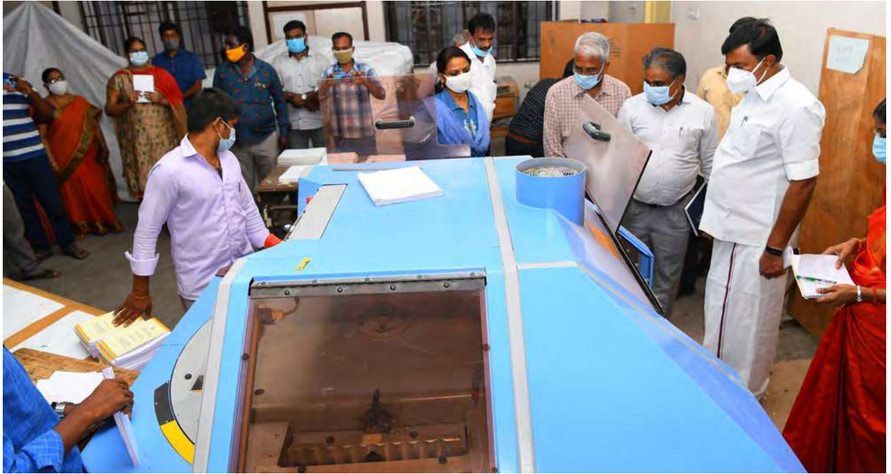
மாண்புமிகு செய்தித்துறை அமைச்சர் அவர்கள், அரசு மைய அச்சகத்தில் உள்ள புத்தகம் கட்டும் இயந்திரத்தைப் பார்வையிட்டார்.