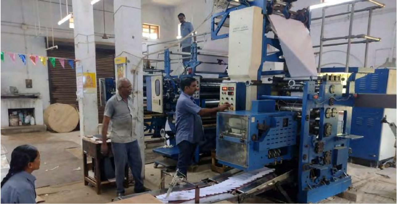
இரு வண்ண வெப் ஆப்செட் இயந்திரம், அரசு கிளை அச்சகம், புதுக்கோட்டை.