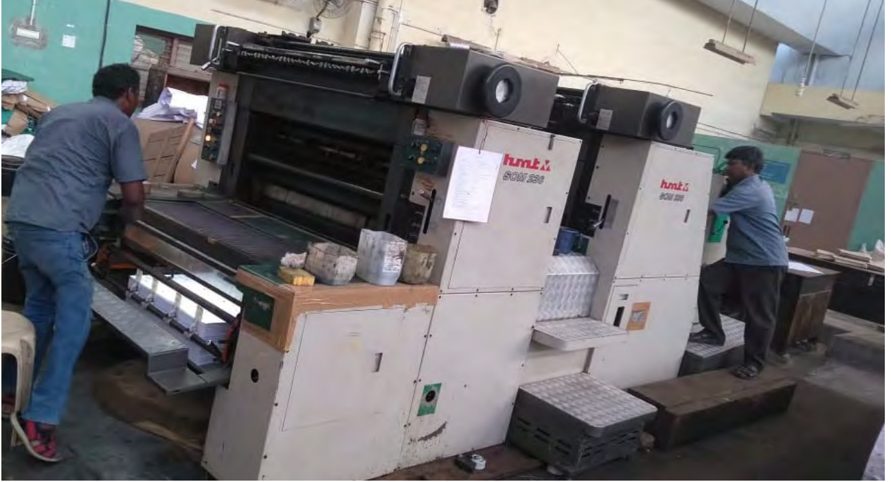
இரு வண்ண தனித்தாள் ஆப்செட் இயந்திரம், அரசு கிளை அச்சகம், மதுரை-7.