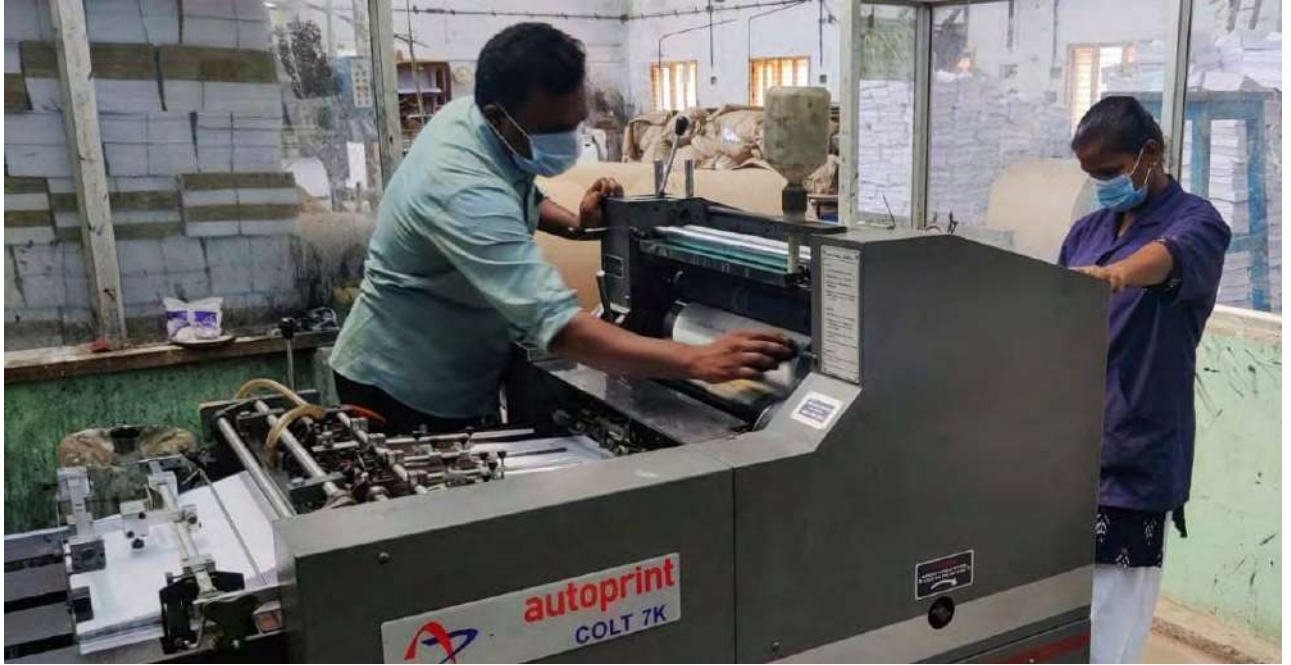
தனித்தாள் அச்ச இயந்திரம், அரசு கிளை அச்சகம், திருச்சி.