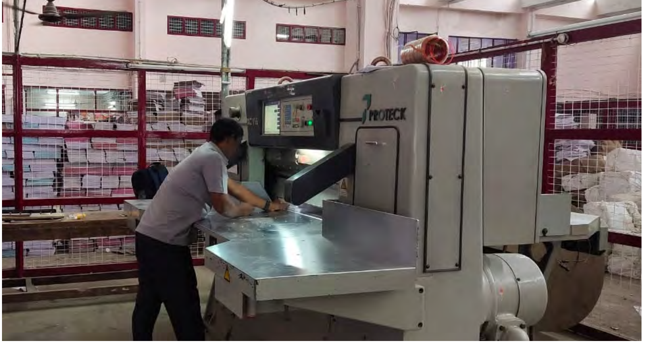
காகிதம் வெட்டும் இயந்திரம், அரசு கிளை அச்சகம், சேலம்.