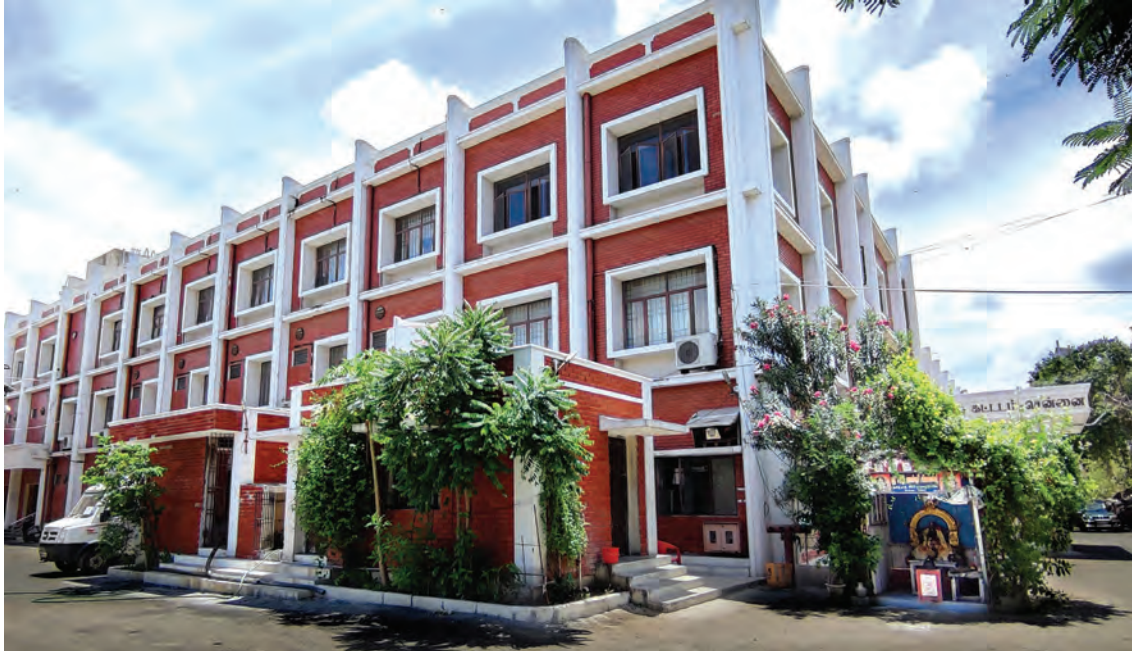
பிரதான கட்டிடம், அரசு மைய அச்சகம், சென்னை-1