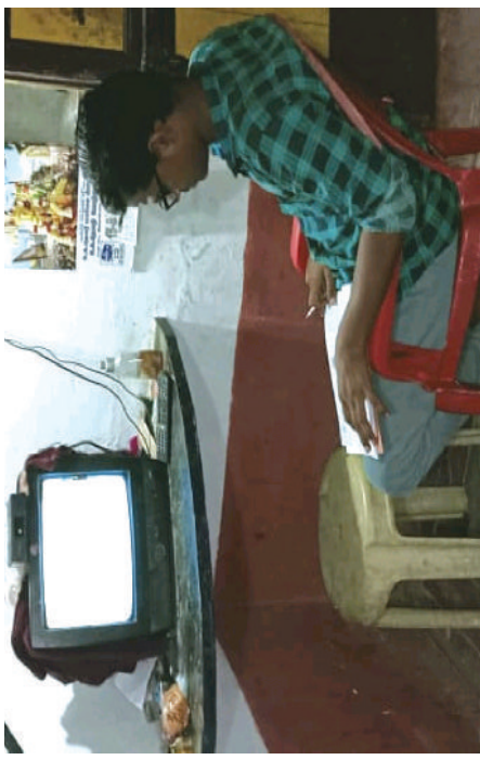
கல்வி ரிதாலைக்காட்சி வாயிலாக மாணவர்கள் பாடங்களைக் கற்றல்.