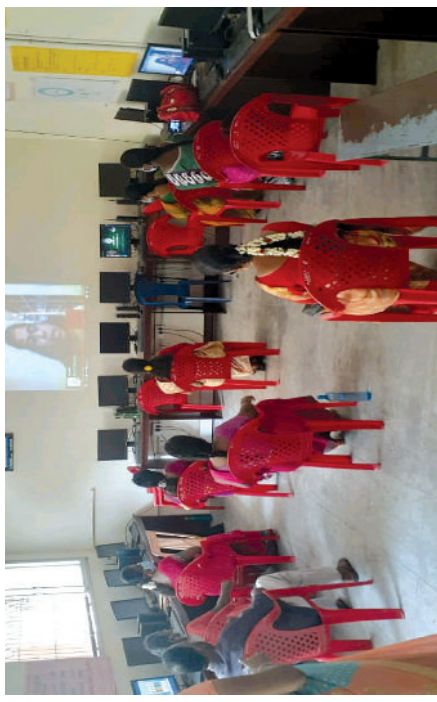
முதுகலை ஆசிரியர்களுக்கு உயர் தொழில்நுட்ப ஆய்வகம் வழியாகப் பயிற்சி நடைபெறுகல்.