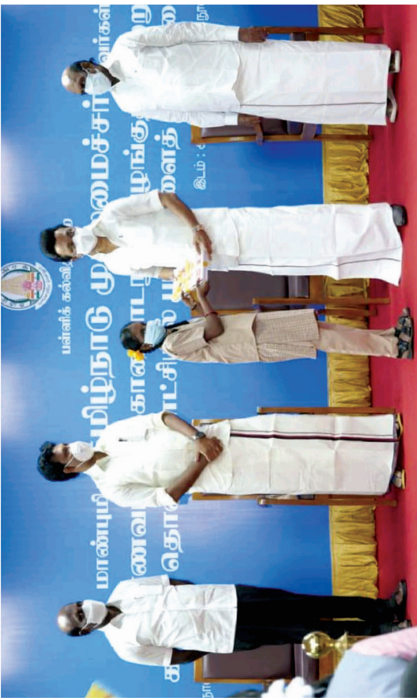
மாண்புமிகு தமிழ்நாடு முதலமைச்சர் திரு. மு. க. ஸ்டாலின் அவர்கள் 19.8.2021 அன்று பள்ளி மாணவர்களுக்கு 2021-22 ஆம் ஆண்டுக்கான பாடப்புத்தகங்களை வழங்கினார்கள்.