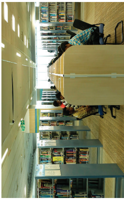
சென்னை கோட்டூரத்தில் உள்ள அண்ணா நூற்றாண்டு நூலகத்தின் எழில்மிகு தோற்றம்.