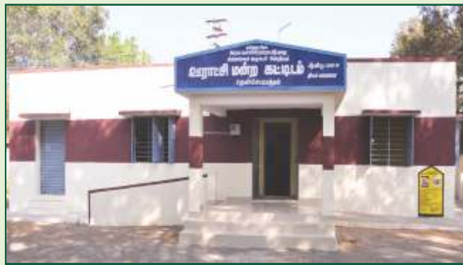
மகாத்மா காந்தி தேசிய ஊரக வேலை உறுதி திட்டப் பணிகள்