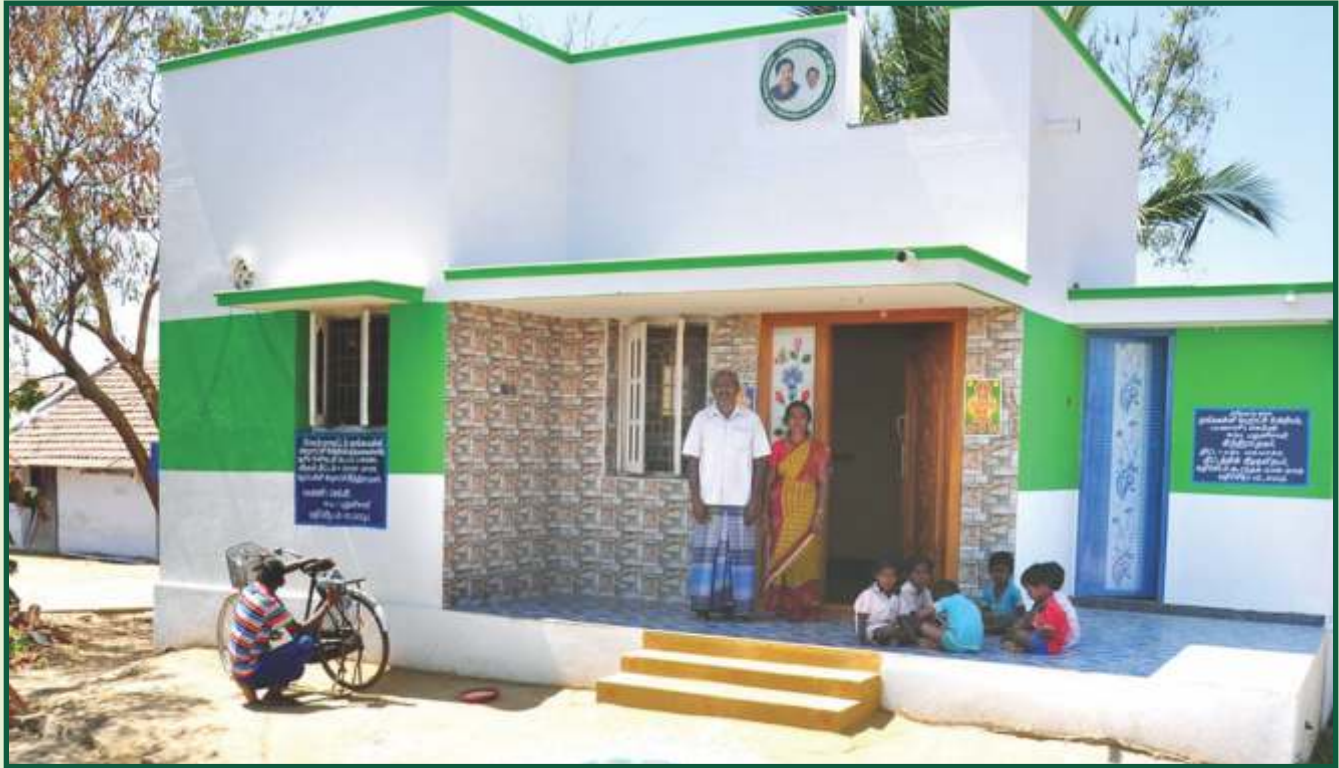
முதலமைச்சரின் சூரிய மின்சக்தியுடன் கூடிய பசுமை வீடு