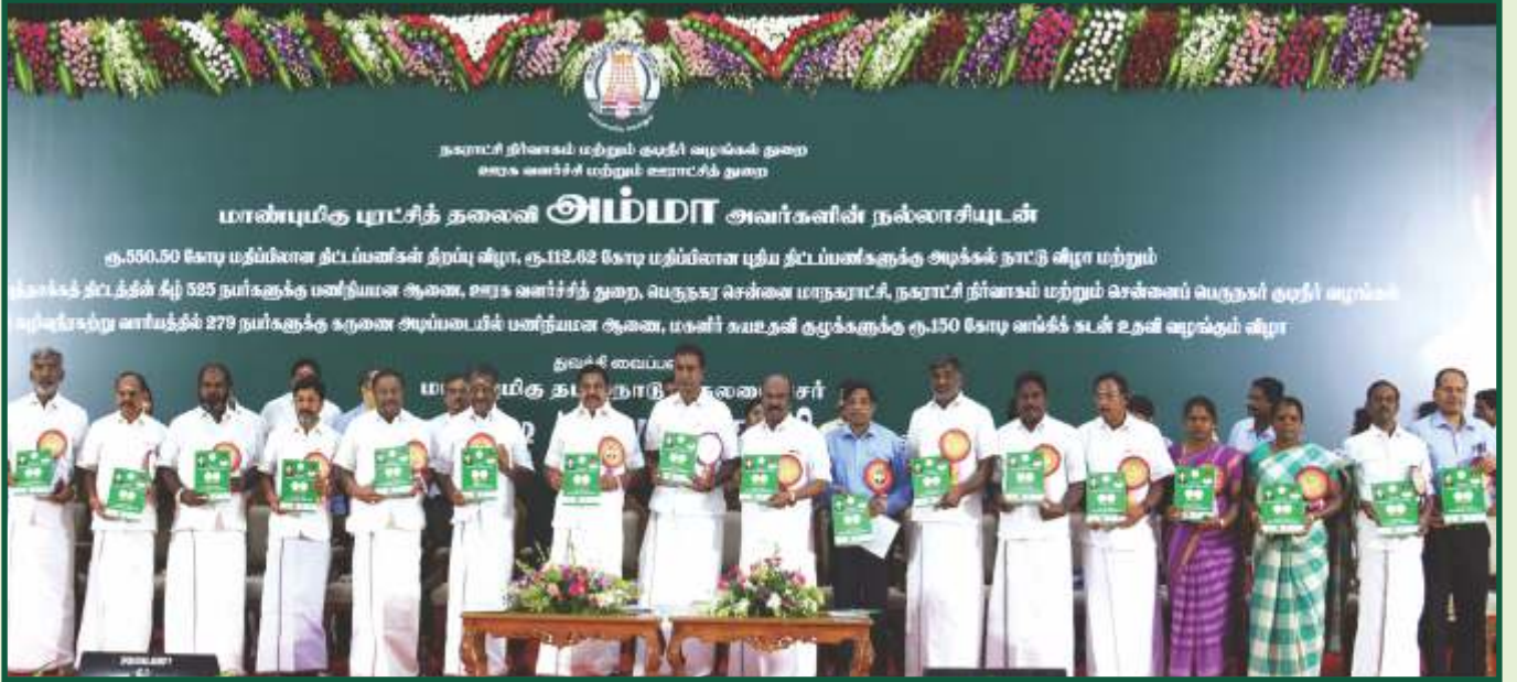
மனநலத் திட்டம் குறித்த "மனம் இனிது பயிற்சிப் புத்தகம்" 31.10.2019 அன்று சென்னையில் வெளியிடுதல்