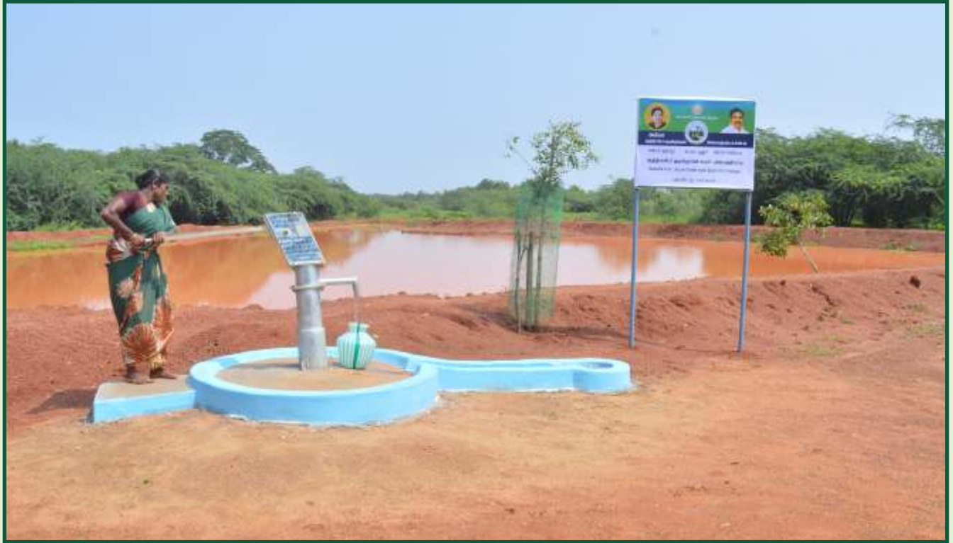
அம்மா - ஆதி திராவிடர் குடியிருப்புகள் மேம்பாட்டுத் திட்டப் பணி