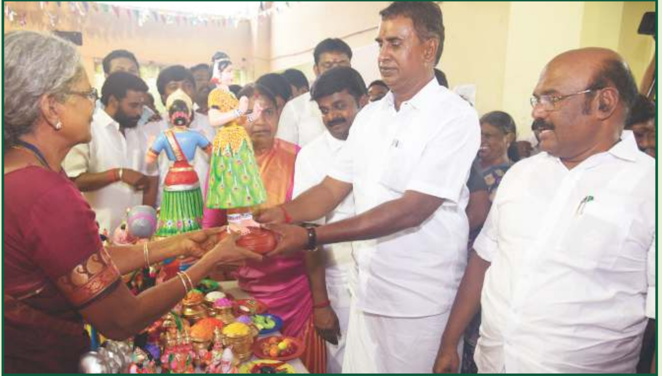
சென்னையில் நடைபெற்ற மகளிர் சுய உதவிக் குழுவினரால் தயாரிக்கப்பட்ட பொருட்களின் விற்பனைக் கண்காட்சி