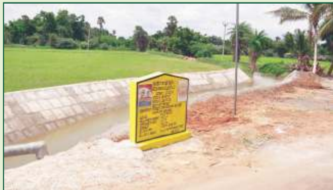
மகாத்மா காந்தி தேசிய ஊரக வேலை உறுதி திட்டப் பணிகள்