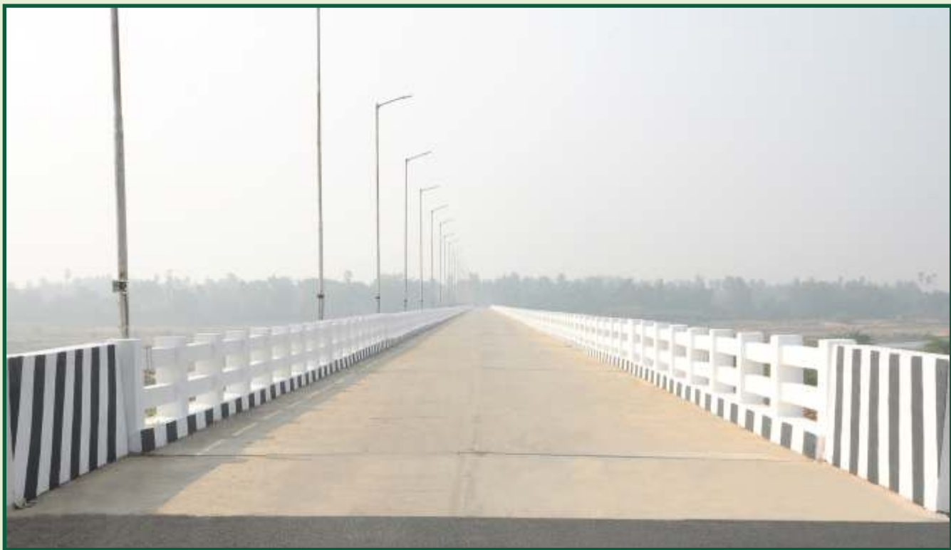
புதிய பாலம் அமைத்தல்