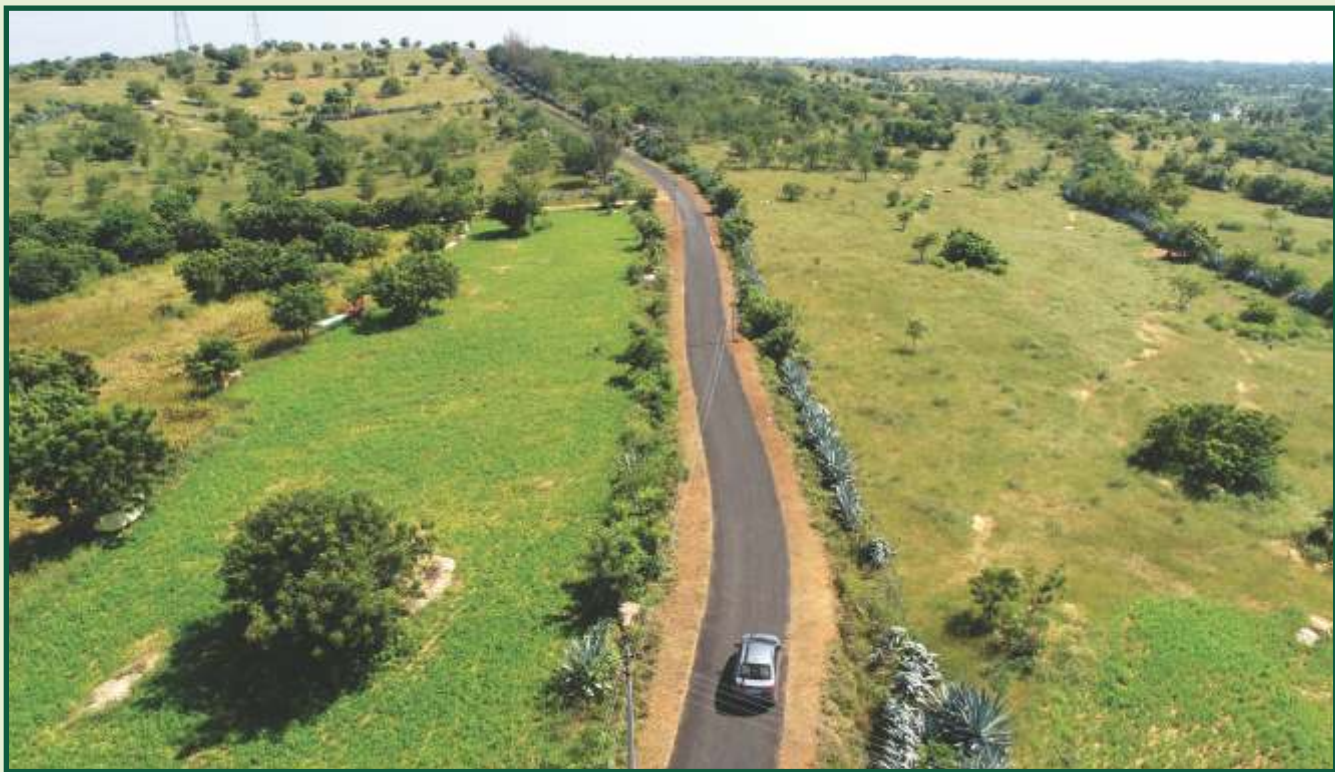
தார்ச் சாலை அமைத்தல்