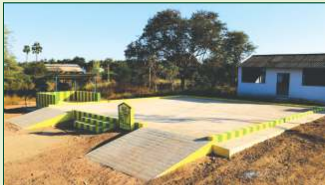
மகாத்மா காந்தி தேசிய ஊரக வேலை உறுதி திட்டப் பணிகள்