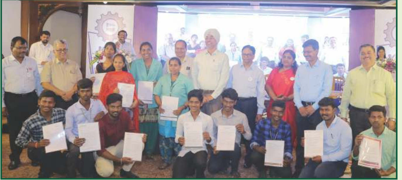
DDU - GKY திட்டத்தின் கீழ் இளைஞர்களுக்கு பணி நியமன ஆணைகள் வழங்கப்பட்டது