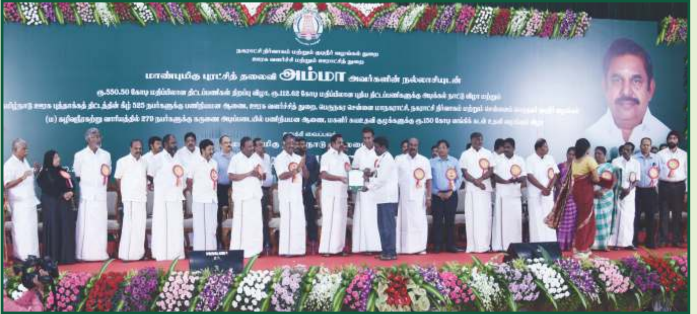
சென்னையில் தமிழ் நாடு ஊரக புத்தாக்கத் திட்டத்தின் கீழ் 525 நபர்களுக்கு பணி நியமன ஆணைகள் வழங்கப்பட்டது