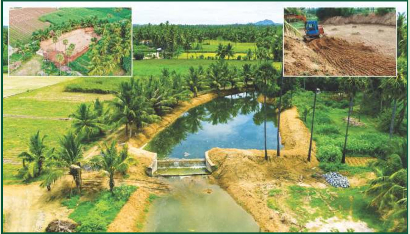
தமிழ்நாடு நீர்வள ஆதார பாதுகாப்பு மற்றும் நீர் மேலாண்மை இயக்கம் – குடிமராமத்து