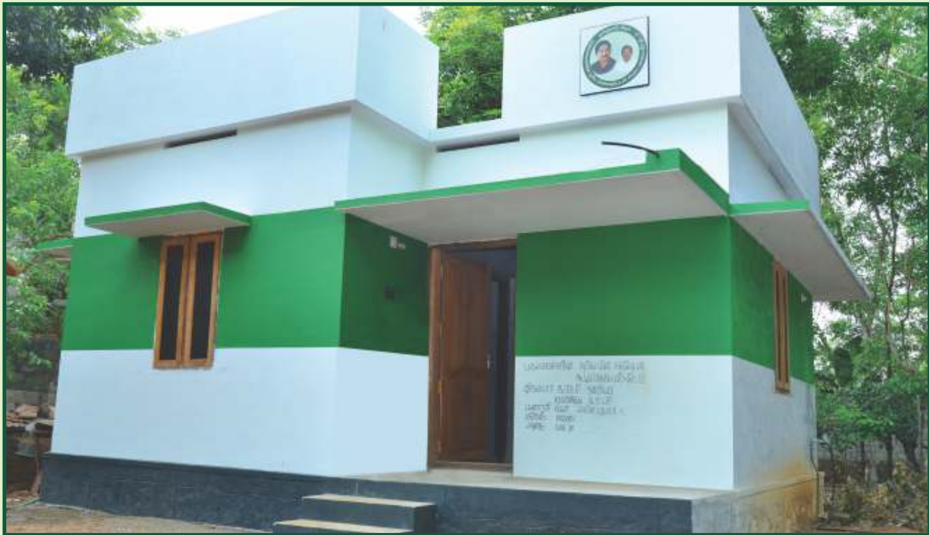
முதலமைச்சரின் சூரிய மின்சக்தியுடன் கூடிய பசுமை வீடு