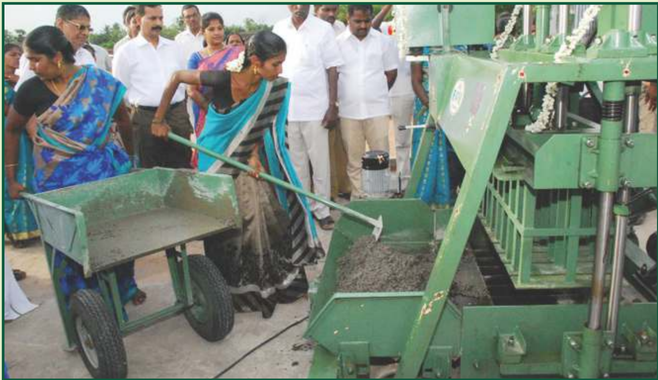
ஹாலோ பிளாக் தயாரிப்பு அலகு, கடலூர் மாவட்டம்