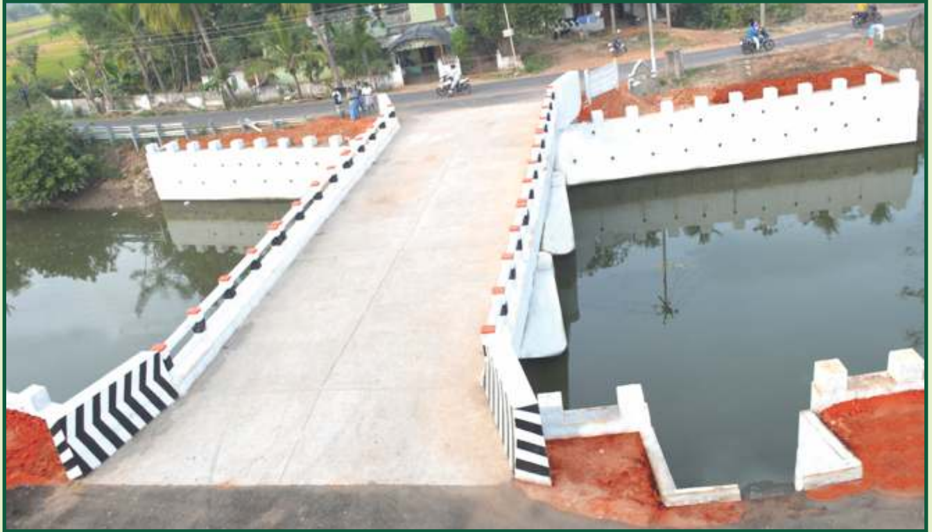
புதிய பாலம் அமைத்தல்