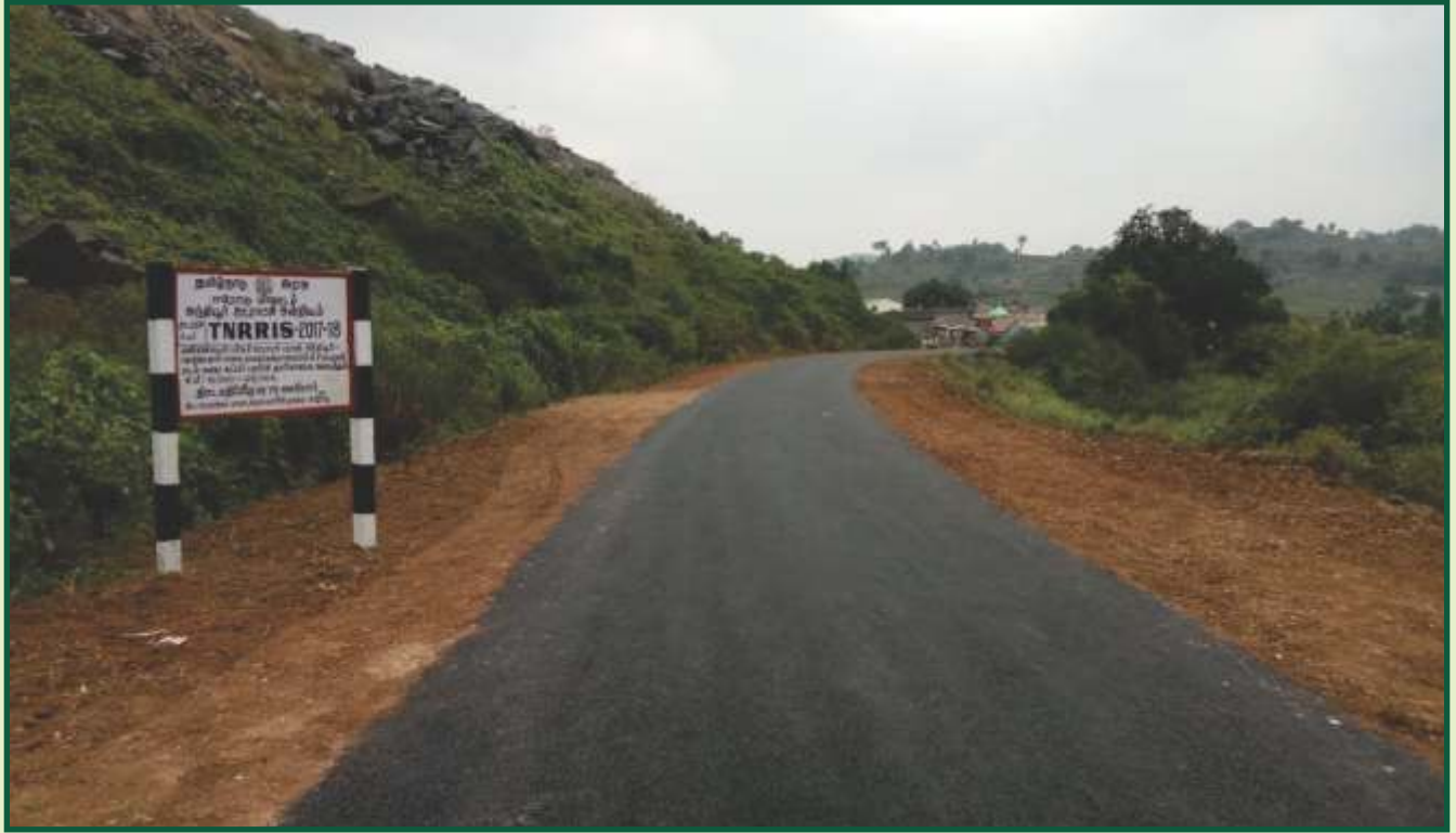
தார்ச் சாலை அமைத்தல்