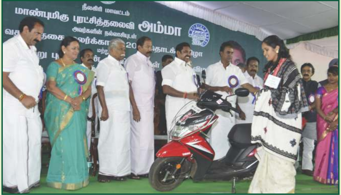
நீலகிரி மாவட்டத்தில் 18.05.2018 அன்று நடைபெற்ற அம்மா இருசக்கர வாகனங்கள் வழங்கும் விழா