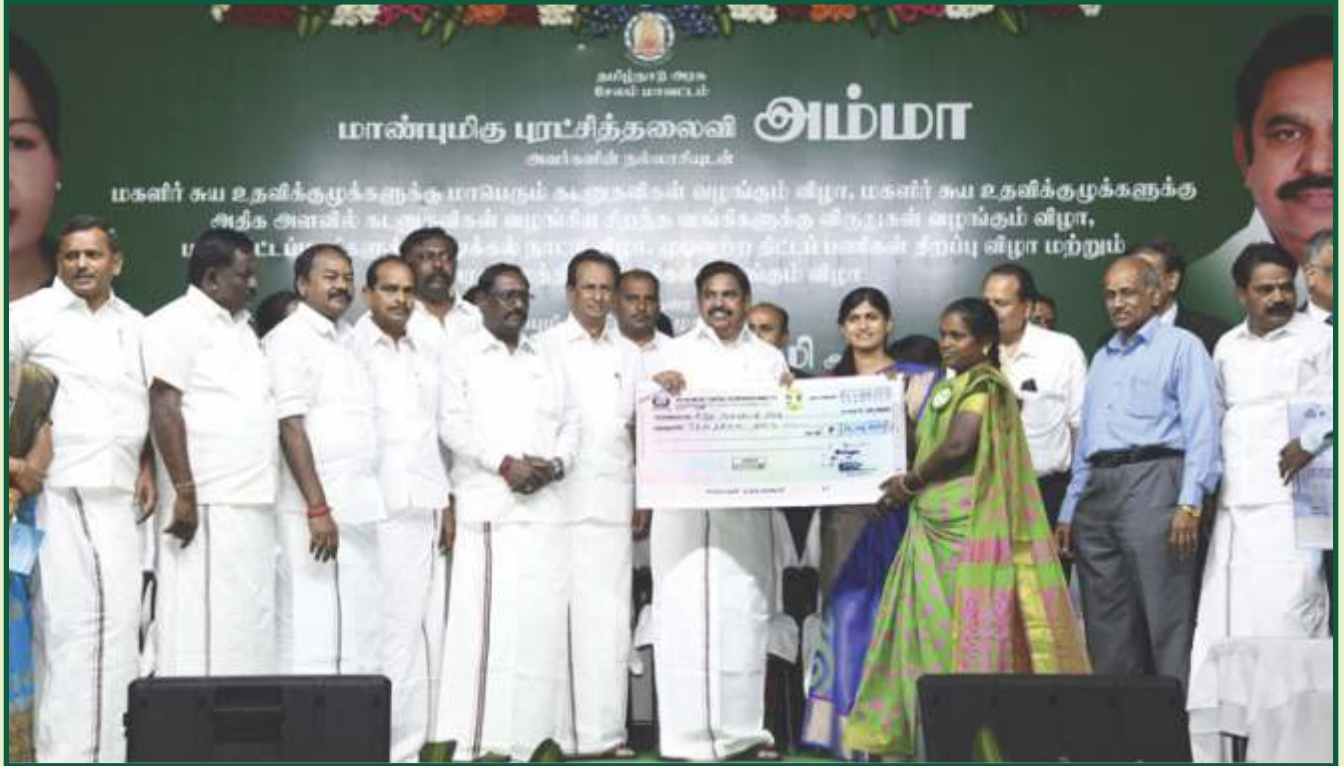
சேலத்தில் 25.02.2019 அன்று நடைபெற்ற மகளிர் சுய உதவிக் குழுக்களுக்கான மாபெரும் கடனுதவி வழங்கும் விழா