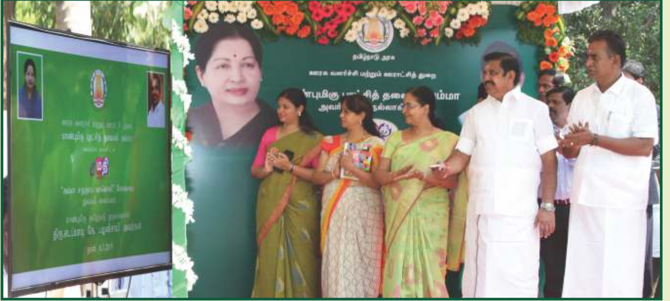
இ-மதி செயலி வாயிலாக சுய உதவிக் குழு உறுப்பினர்களுக்கான அம்மா சமுதாய வானொலி துவங்கப்பட்டது