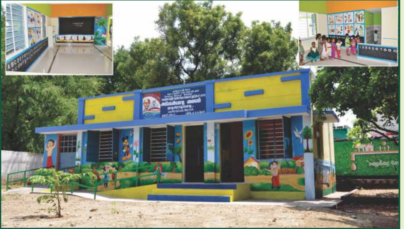
புதிய அங்கன்வாடி கட்டடம்