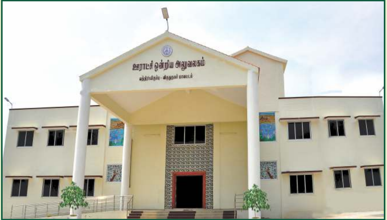
புதிய ஊராட்சி ஒன்றிய அலுவலகம்