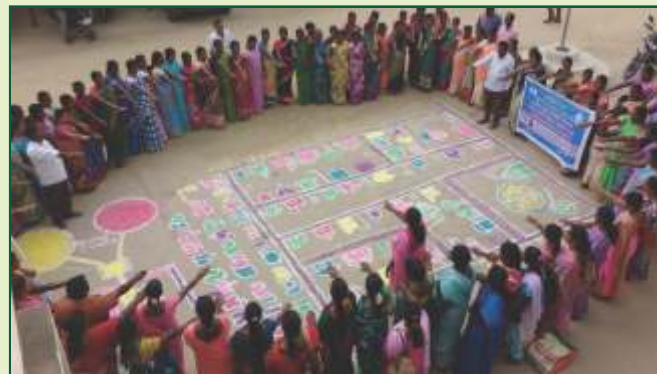
முழு சுகாதார தமிழகம் – முன்னோடி தமிழகம்