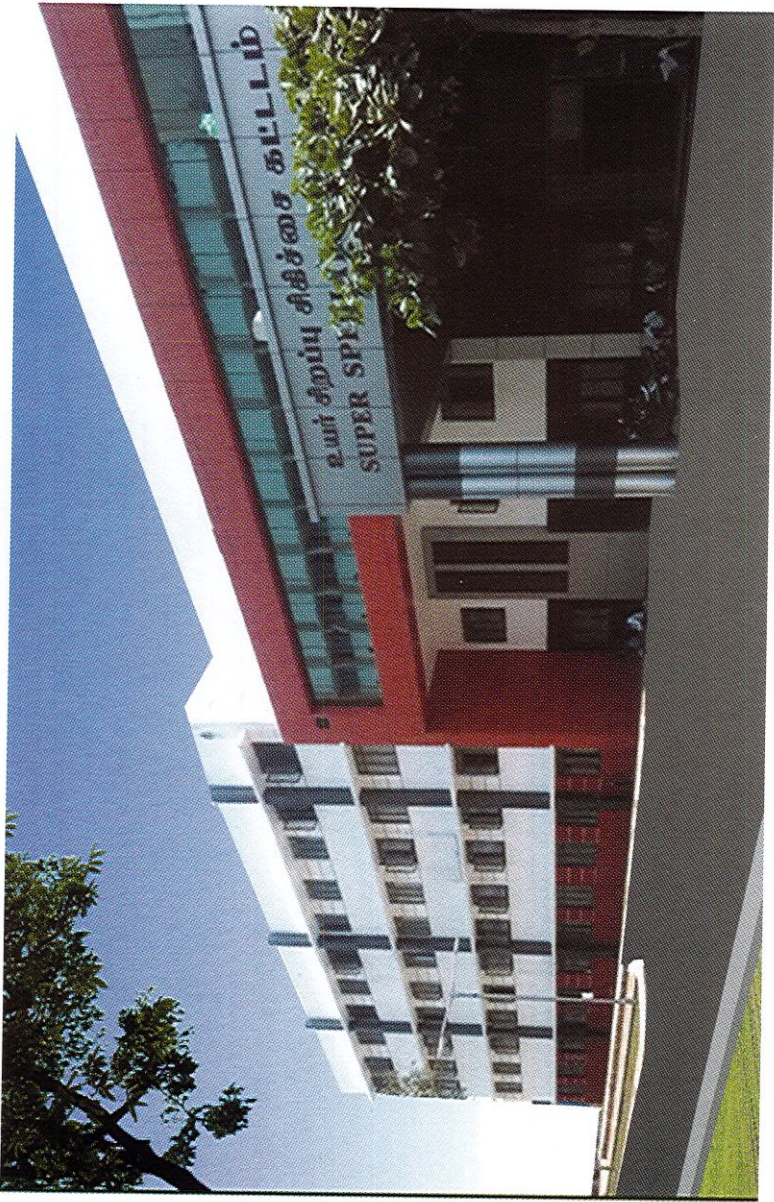
உயர்சிறப்பு சிகிச்சை கட்டிடம், அரசு ஸ்டான்லி மருத்துவமனை, சென்னை