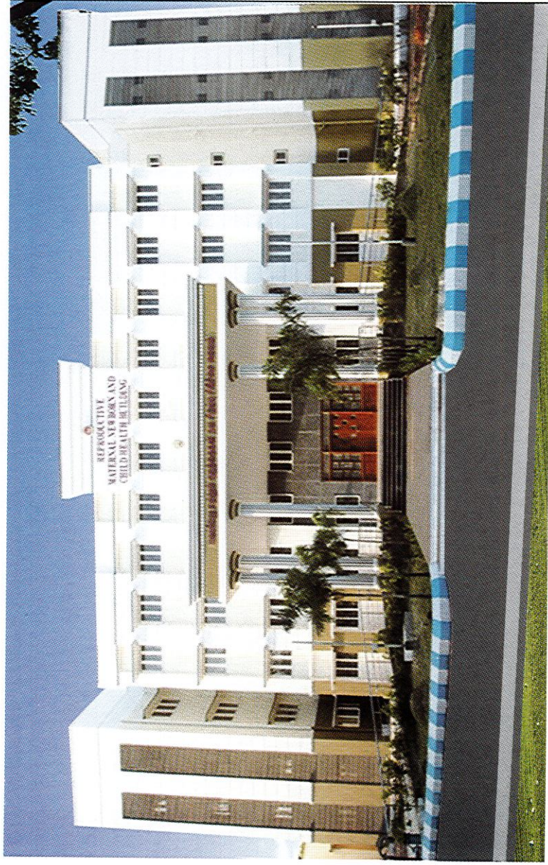
தாய் சேய் மற்றும் குழந்தைகள் நல மையக் கட்டடம், அரசு தலைமை மருத்துவமனை, கடலூர்