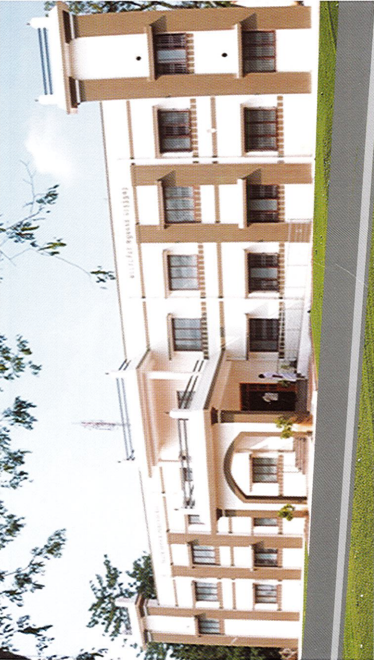
வட்டாட்சியர் அலுவலக கட்டிடம், பெருந்துறை, ஈரோடு மாவட்டம்