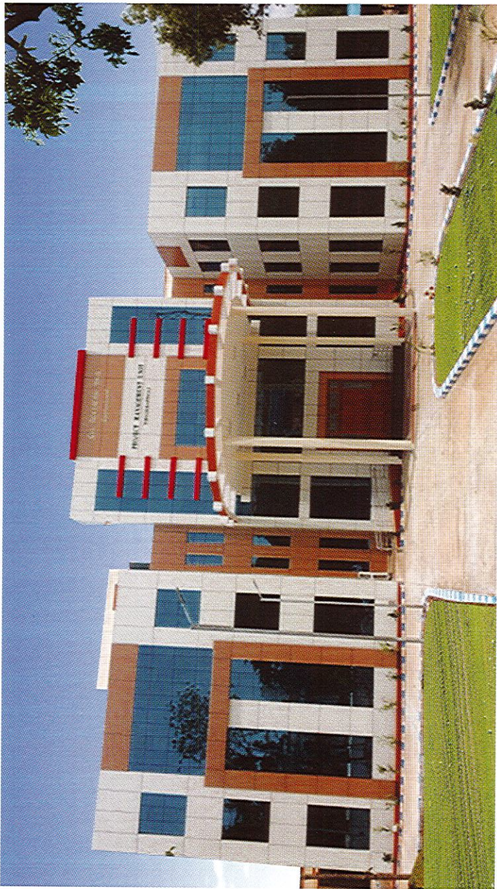
திட்ட மேலாண்மை அலகு கட்டடம், திருச்சிராப்பள்ளி