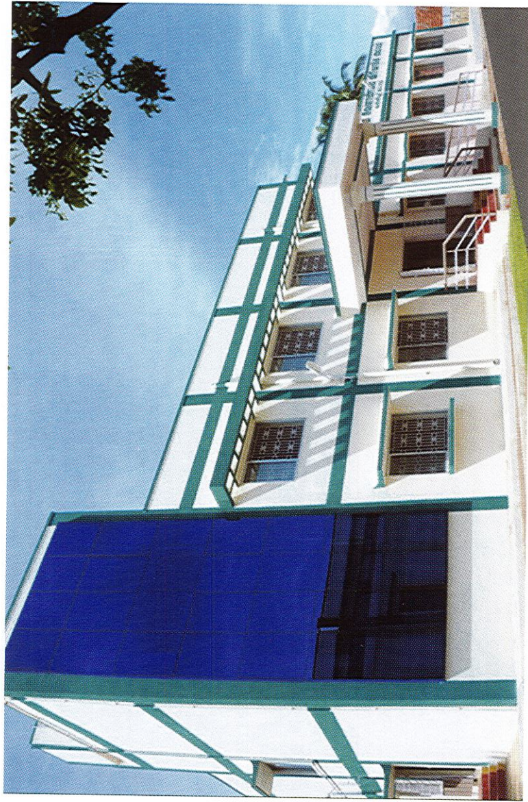
ஒருங்கிணைந்த வேளாண் விரிவாக்க மையம், வள்ளியூர், திருநெல்வேலி மாவட்டம்