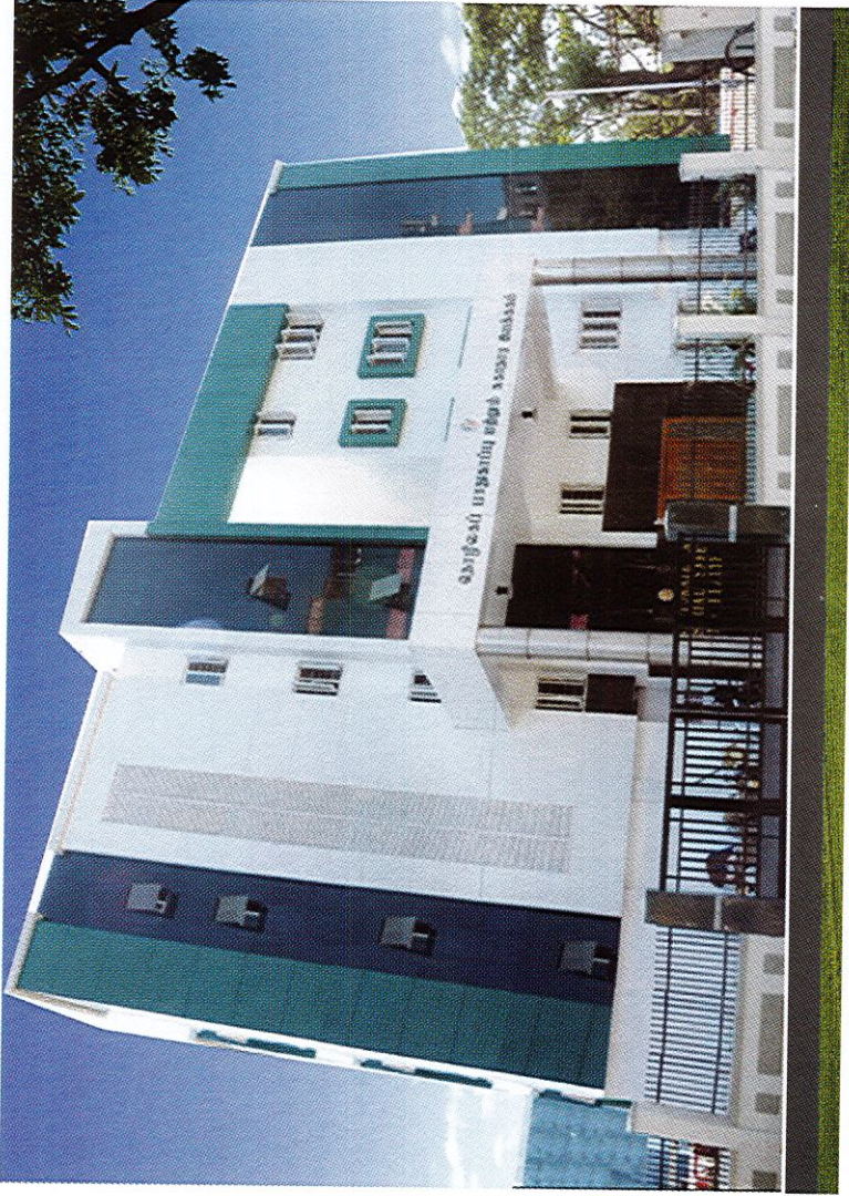
தொழிலகப் பாதுகாப்பு அலுவலக கட்டடம், கிண்டி, சென்னை