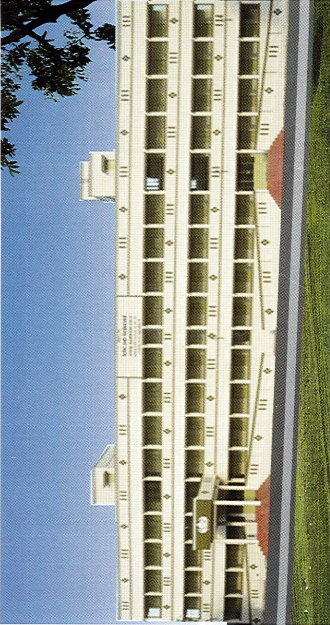
பள்ளிக் கட்டடம் (நுபாட்டு திட்டம்), செம்யார், திருவண்ணாமலை மாவட்டம்