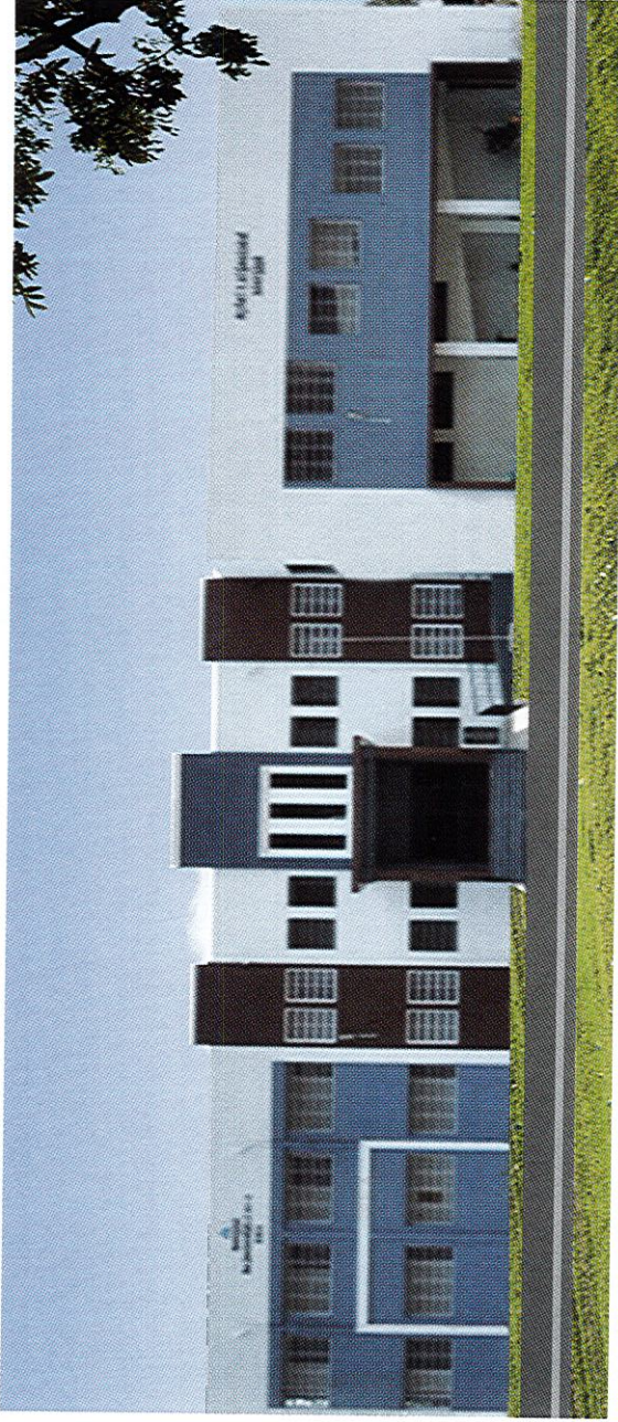
பள்ளிக் கட்டடம் (அனைவருக்கும் இடைநிலைக் கல்வித் திட்டம்), ஆத்தூர், சேலம் மாவட்டம்