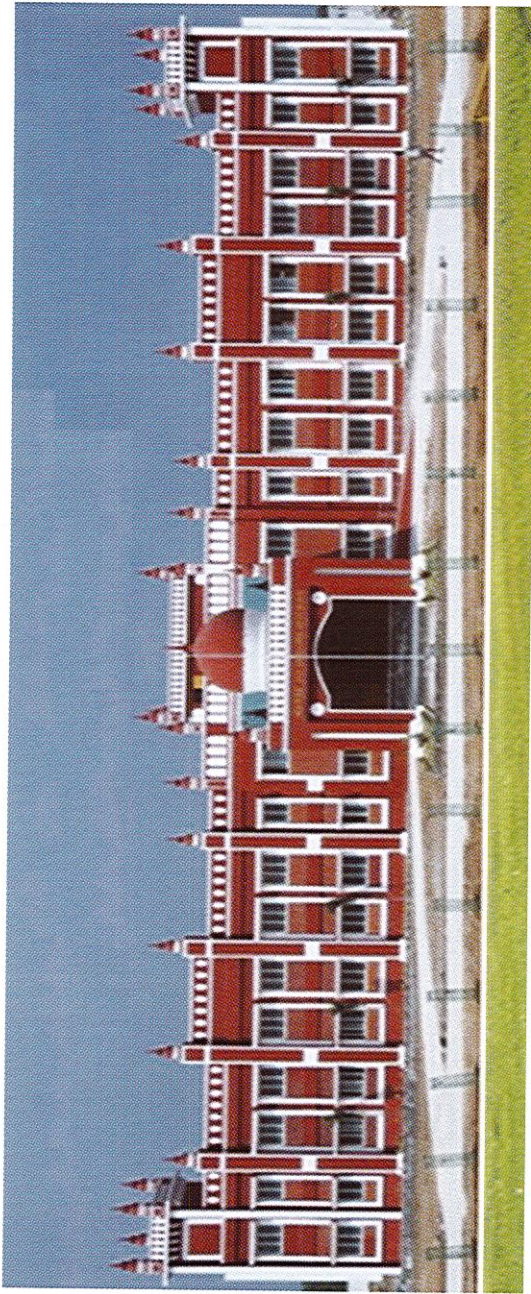
அரசு சட்டக் கல்லூரி நிர்வாகக் கட்டடம், புதுப்பாக்கம், காஞ்சிபுரம் மாவட்டம்