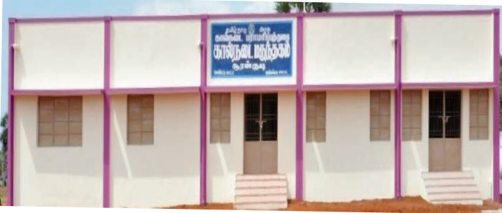
கால்நடை மருந்தகம், சூரன்குடி, தூத்துக்குடி மாவட்டம்

தூத்துக்குடி, புதுக்கோட்டை மற்றும் கிருஷ்ணகிரி ஆகிய இடங்களில் 6.00 கோடி ரூபாய் மதிப்பீட்டில் கால்நடை மருத்துவமனைக் கட்டடங்கள் கட்டும் பணிகள் நடைபெற்று வருகின்றன.