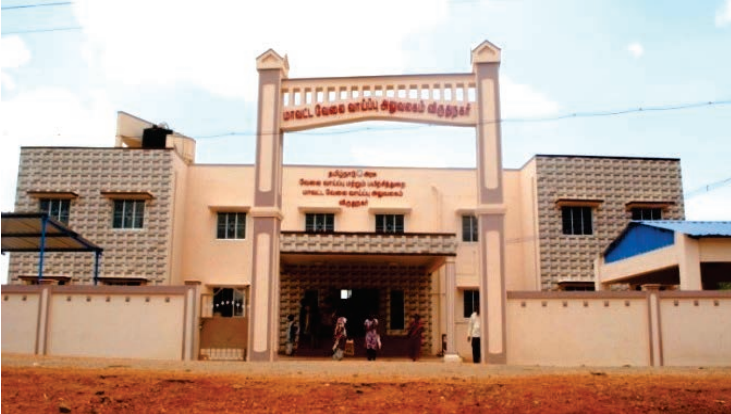
மாவட்ட வேலைவாய்ப்பு அலுவலகம், விருதுநகர்

3.15.3. மதுரை மாவட்டத்தில் தொழிலாளர் நலத் துறையின் ஒருங்கிணைந்த அலுவலகக் கட்டடம் 1.35 கோடி ரூபாய் மதிப்பீட்டில் கட்டும் பணி நடைபெற்று வருகிறது. 30.09.2014க்குள் பணிகள் முடிக்கப்படும்.