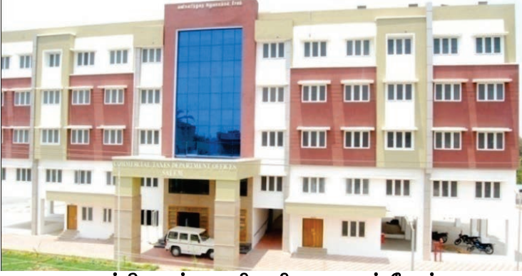
ஒருங்கிணைந்த வணிகவரி அலுவலகம், சேலம்

3.22.4. 24 இடங்களில் சிறிய சோதனைச் சாவடி மற்றும் சோதனை மையங்களை, 6.81 கோடி ரூபாய் மதிப்பீட்டில் மேம்படுத்தும் பணிகள் நடைபெற்று வருகின்றன.