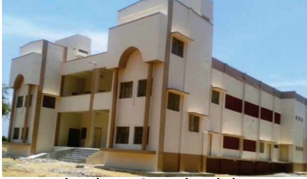
சமூக நலக் கூடம், குடிகாடு, கடலூர் மாவட்டம்

3.9. கடலோரப் பகுதி பேரிடர் பாதிப்பு குறைப்புத் திட்டம்