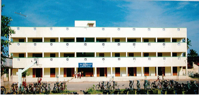
19 வகுப்பறைக் கட்டடம், குத்தாலம், நாகப்பட்டினம் மாவட்டம்

மேற்கண்ட பணிகளில், 1147 பணிகள் முடிக்கப்பட்டன. எஞ்சிய பணிகள் நடைபெற்று வருகின்றன.