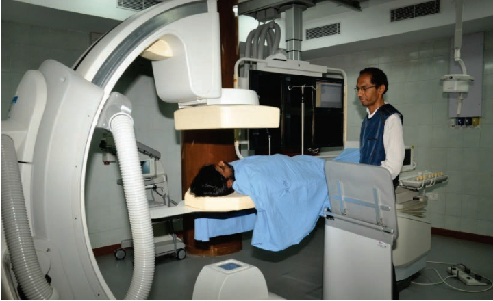
கேத் லேப் பன்னோக்கு உயர் சிறப்பு மருத்துவமனை