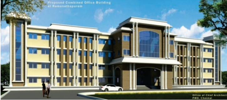
இராமநாதபுரம் மாவட்டம், இராமநாதபுரம் பெருந்திட்ட வளாகத்தில் ஒருங்கிணைந்த அலுவலக வளாகக் கட்டடம்

3.3.14. இராமநாதபுரம் மாவட்டம், இராமநாதபுரம் பெருந்திட்ட வளாகத்தில் 26 அலுவலகங்களின் ஒருங்கிணைந்த வளாகக் கட்டடம் மற்றும் கூட்ட அரங்கு கட்டும் பணி 11.00 கோடி ரூபாய் மதிப்பீட்டில் நடைபெற்று வருகிறது. 30.11.2015க்குள் பணிகள் முடிக்கப்படும்.