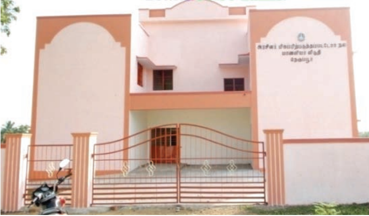
மிகப்பிற்படுத்தப்பட்டோர் நல மாணவியர் விடுதி, நெருப்பூர், தருமபுரி மாவட்டம்

3.7.2. பிற்படுத்தப்பட்டோர், மிகவும் பிற்படுத்தப்பட்டோர் மற்றும் சிறுபான்மையினர் மாணவ மாணவியருக்கான 575 விடுதிக் கட்டடங்களுக்கு, 25.00 கோடி ரூபாய் மதிப்பீட்டில் புதுப்பிக்கும் பணிகள் நடைபெற்று வருகின்றன.