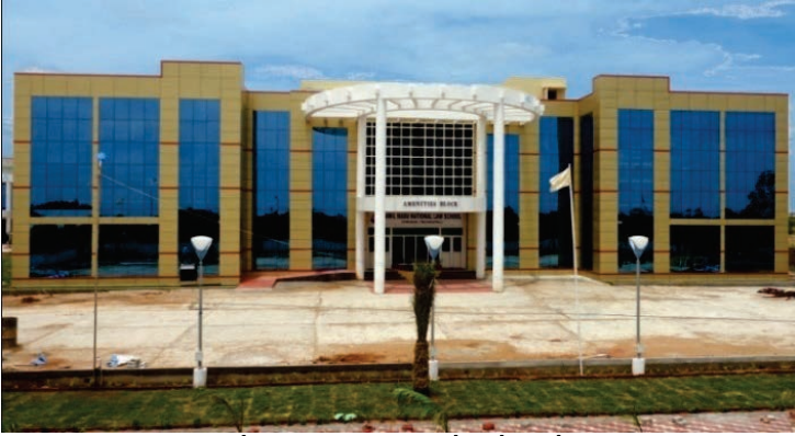
பல்வகை அலுவலகக் கட்டிடம்

திருச்சிராப்பள்ளி மாவட்டம், நாவலூர் குட்டப்பட்டு கிராமம், ஸ்ரீரங்கத்தில்