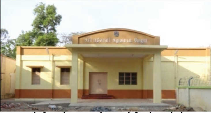
சார்பதிவாளர் அலுவலகம், ஓமலூர், சேலம் மாவட்டம்

3.22.2. 52 இடங்களில் சார்பதிவாளர் அலுவலகக் கட்டடங்கள், 26.00 கோடி ரூபாய் மதிப்பீட்டில் கட்டும் பணிகள் நடைபெற்று வருகின்றன.