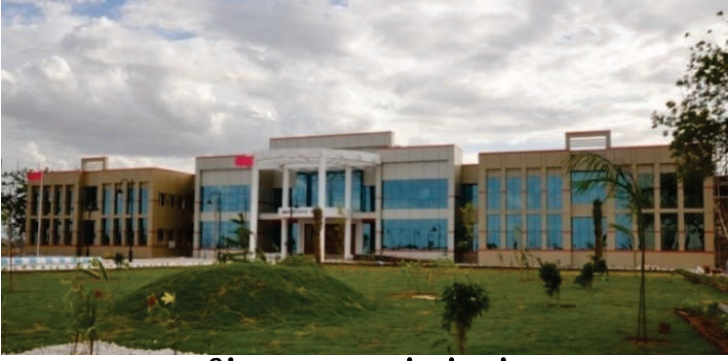
நிர்வாக அலுவலகக் கட்டிடம்

2.9. திருச்சிராப்பள்ளி மாவட்டம், நாவலூர் குட்டப்பட்டு கிராமம், ஸ்ரீரங்கத்தில் தமிழ்நாடு தேசிய சட்டப் பள்ளி