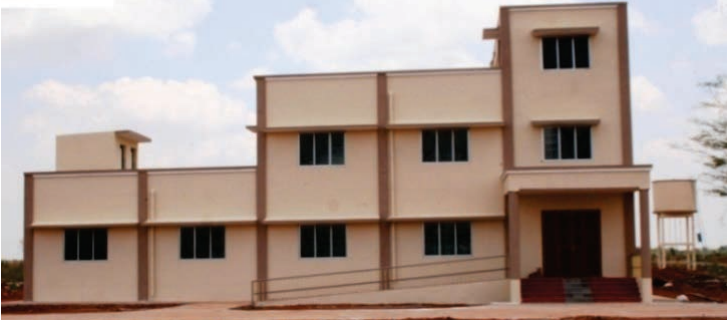
தஞ்சாவூர் மாவட்டம், ஈச்சங்கோட்டையில் உள்ள ஓரத்தநாடு கால்நடை அபிவிருத்தி பண்ணையில் உழவர்களுக்காக பயிற்சி நிலையக் கட்டடம்

3.4.4. தஞ்சாவூர் மாவட்டம், ஈச்சங்கோட்டையில் உள்ள ஓரத்தநாடு கால்நடை அபிவிருத்தி பண்ணையில் உழவர்களுக்காக பயிற்சி நிலையக் கட்டடம் 1.56 கோடி ரூபாய் மதிப்பீட்டில் கட்டும் பணி நடைபெற்று வருகிறது. 31.07.2014க்குள் பணிகள் முடிக்கப்படும்.