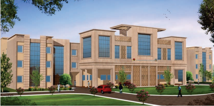
நிர்வாக அலுவலகக் கட்டடம், தமிழ்நாடு டாக்டர் அம்பேத்கர் சட்டப் பல்கலைக் கழகம், பெருங்குடி, சென்னை

3.17.1. சென்னை, பெருங்குடியில் தமிழ்நாடு டாக்டர் அம்பேத்கர் சட்டப் பல்கலைக் கழகத்திற்கு புதிய கட்டடங்கள் 59.27 கோடி ரூபாய் மதிப்பீட்டில் கட்டும் பணி நடைபெற்று வருகிறது. இக்கட்டப் பணிகள் 20.08.2015க்குள் முடிக்கப்படும்.