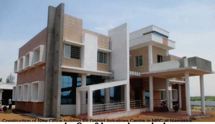
மாவட்ட தொழில் மையம், நாமக்கல்