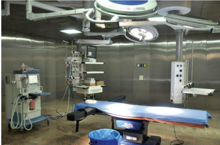
அறுவை சிகிச்சை அரங்கு பன்னோக்கு உயர் சிறப்பு மருத்துவமனை