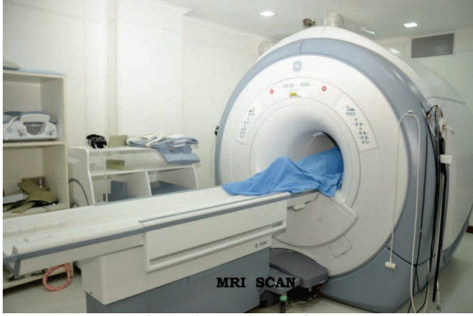
எம்.ஆர்.ஐ. ஸ்கேன் பன்னோக்கு உயர்சிறப்பு மருத்துவமனை