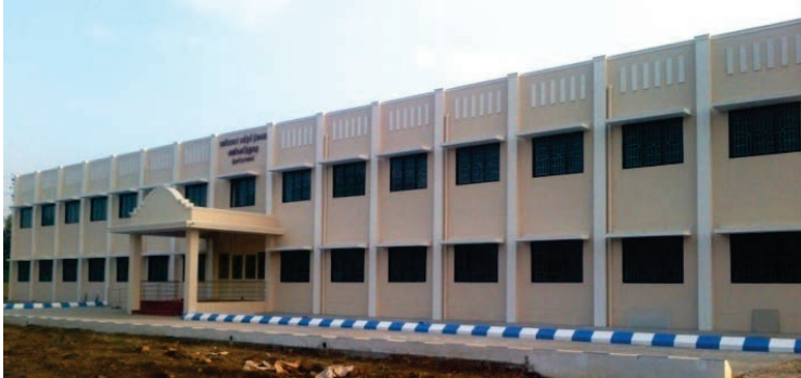
வணிகவரித்துறை பணியாளர் பயிற்சி நிலையம், திருச்சிராப்பள்ளி

மேற்கண்ட பணிகளில், 15 பணிகள் முடிவுற்றன. எஞ்சிய பணிகள் நடைபெற்று வருகின்றன.