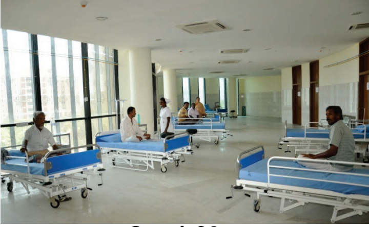
பொதுப் பிரிவு பன்னோக்கு உயர் சிறப்பு மருத்துவமனை