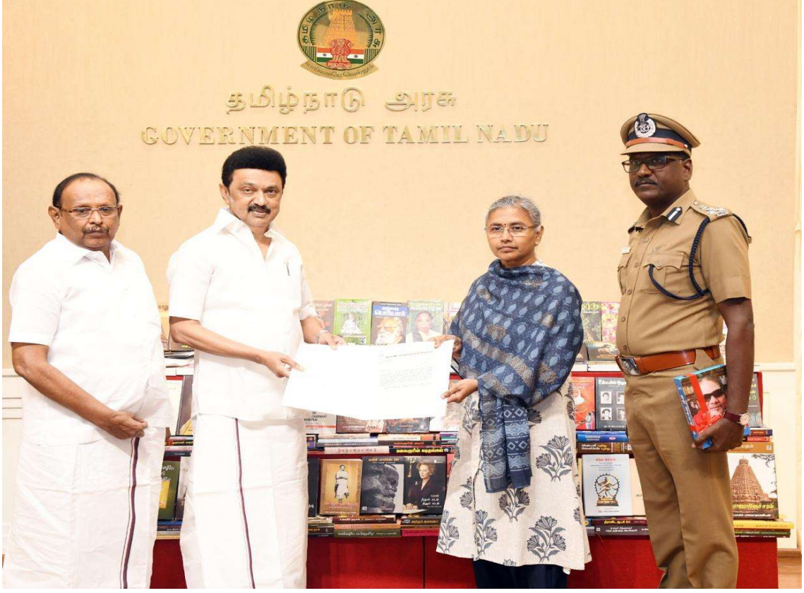
மாண்புமிகு தமிழ்நாடு முதலமைச்சர் திரு.மு.க.ஸ்டாலின் அவர்கள் 1500 புத்தகங்களை தமிழ்நாட்டில் உள்ள சிறை நூலகங்களுக்கு 28,10,2023 அன்று வழங்கினார்.