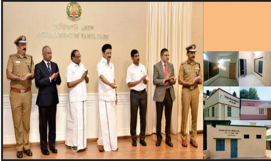
மாண்புமிகு தமிழ்நாடு முதலமைச்சர் அவர்கள் 25.11.2022 அன்று 12 மாவட்ட சிறை வளாகங்களில் "சோதனை அடையாள அணி வகுப்பு அறை"யினை திறந்து வைத்தார்.