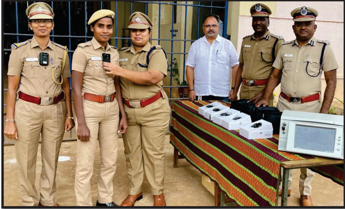
சிறை பாதுகாப்பினை மேம்படுத்திட புழல், மத்திய சிறை-1-க்கு 5 உடல் அணிந்த கேமராக்கள் 8.12.2022 அன்று வழங்கப்பட்டன.