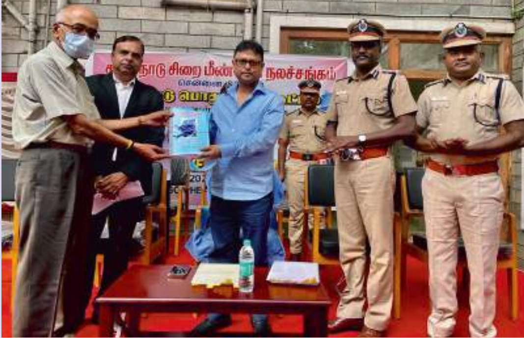
தமிழ்நாடு சிறை மீண்டோர் நலச் சங்கத்தின் ஆண்டு பொதுக்குழுக் கூட்டம் 10.12.2021 அன்று சிறைகள் மற்றும் சீர்திருத்தப் பணிகள் துறை தலைமை இயக்குநர் அலுவலகம், எழும்பூர், சென்னை-8இல் நடைபெற்றது.