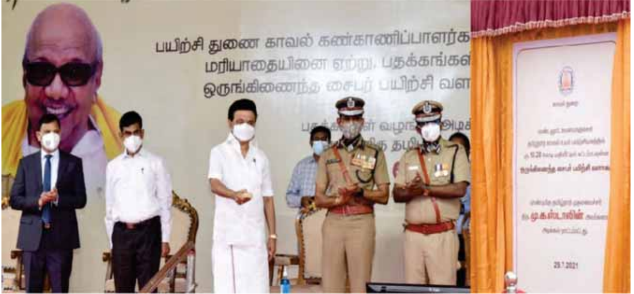
தமிழ்நாடு காவல் உயர் பயிற்சியகத்தில் ஒருங்கிணைந்த இணையதள குற்றப் பயிற்சி வளாகத்திற்கு அடிக்கல் நாட்டுதல் - 29.07.2021.