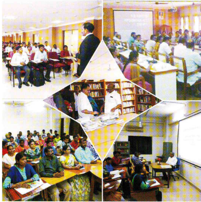
அண்ணா மேலாண்மை நிலையம் அகில இந்திய குடிமைப் பணிகள் தேர்வு பயிற்சி மையம் தலைமைச் செயலக பயிற்சி நிலையம்.