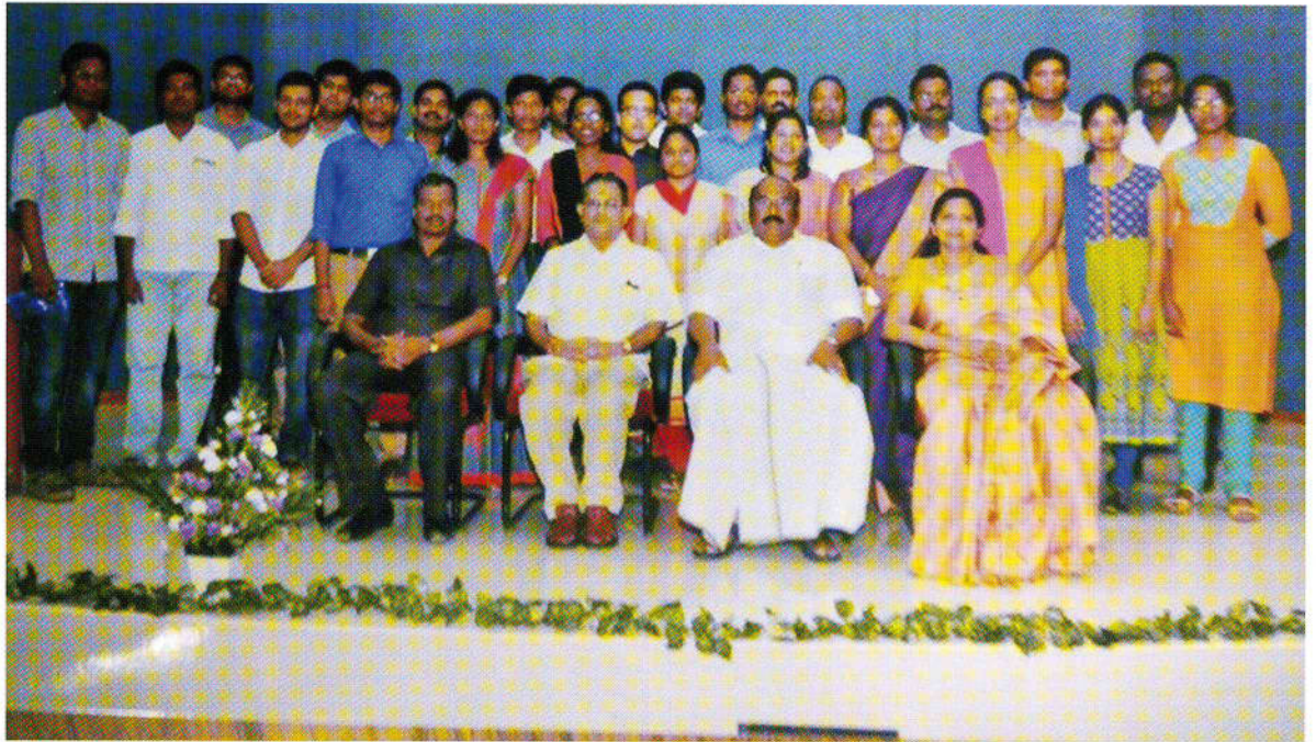
2017-ம் ஆண்டு அகில இந்திய பணிகளுக்காக தெரிவு செய்யப்பட்ட மாணவர்களுடன் மாண்புமிகு அமைச்சர், பயிற்சி துறைத் தலைவர் மற்றும் அகில இந்திய குடிமைப் பணிகள் தேர்வு மைய முதல்வர்.