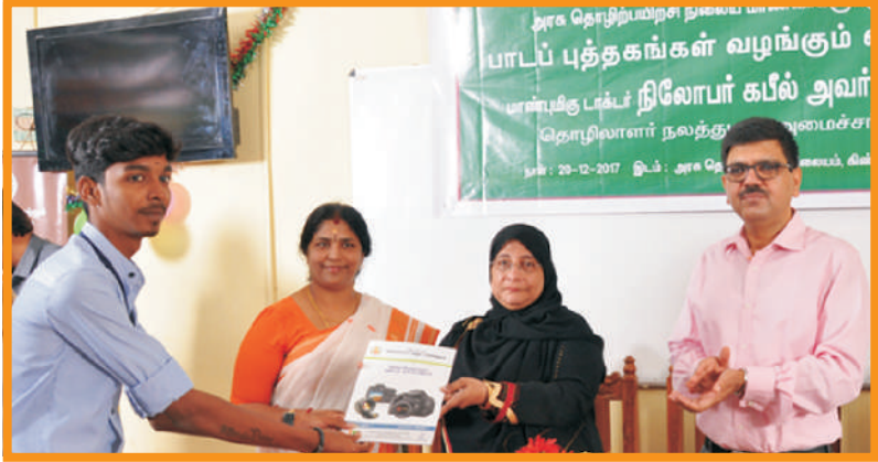
NIMI- நிறுவனத்தால் பாடப்புத்தகங்கள் வெளியிடப்படாத தொழிற்பிரிவுகளுக்கு பாடப்புத்தகங்கள் வழங்குதல்