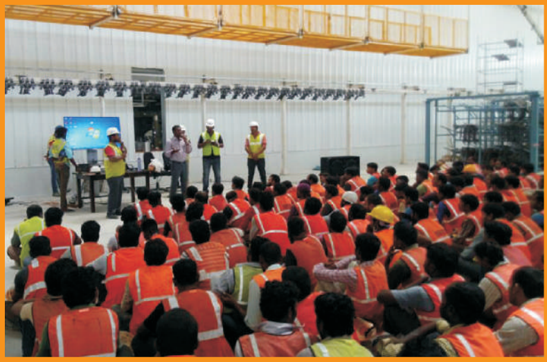
கட்டுமான தொழிலாளர்களுக்கான பாதுகாப்பு விழிப்புணர்வு பயிற்சி