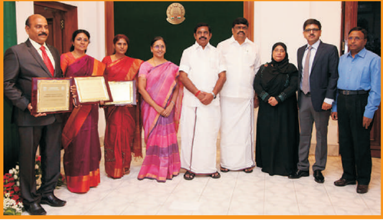
குழந்தை தொழிலாளர் முறை அகற்றுதலில் சிறப்பாக பணியாற்றிய மாவட்ட ஆட்சித்தலைவர்களுக்கு விருது வழங்குதல்