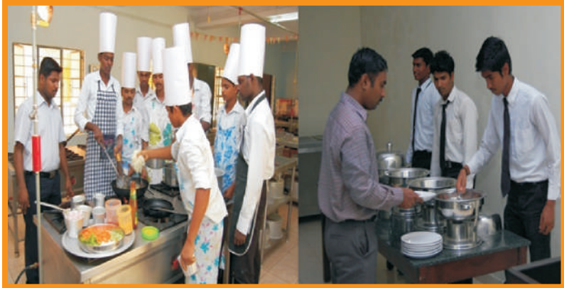
பயிற்சியாளர்களுக்கு உணவு உற்பத்தி பிரிவில் பயிற்சி