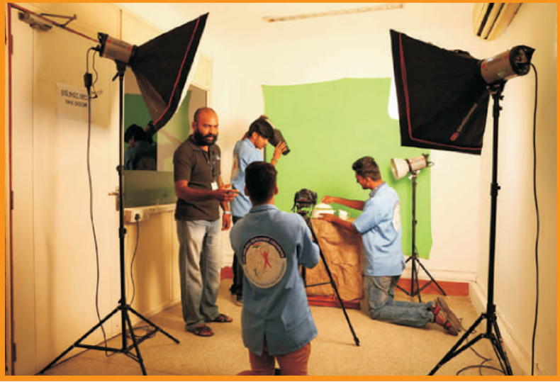
தொழிற்சாலைகளுக்கான புகைப்பட பயிற்சி