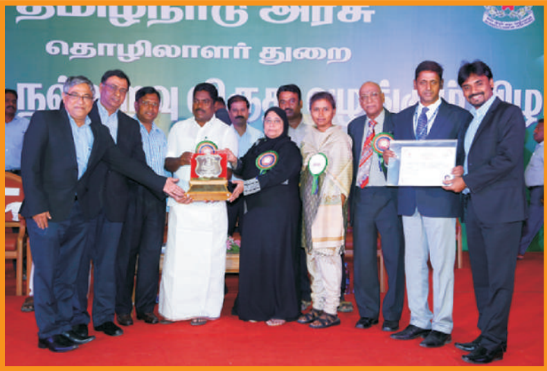
தொழில் நல்லுறவு விருது வழங்குதல்