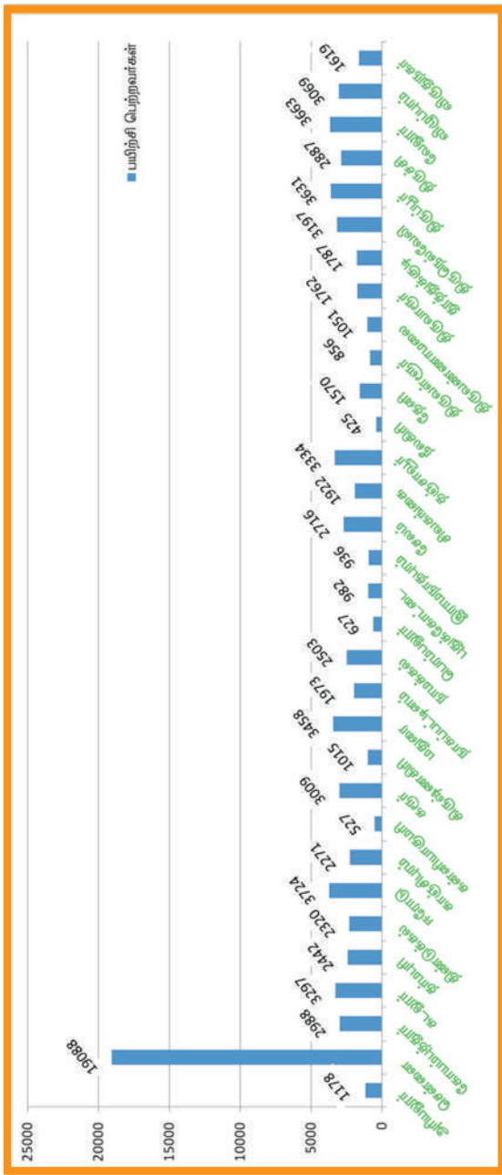
தமிழ்நாடு திறன் மேம்பாட்டுக் கழகம் – மாவட்ட வாரியாக பயிற்சி பெற்றோர் விபரம்