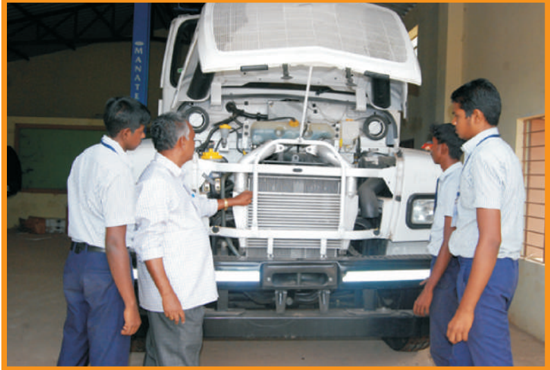
பயிற்சியாளர்களுக்கு மோட்டார் வண்டி தொழிற்பிரிவில் பயிற்சி