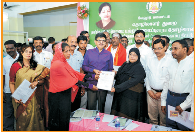
அமைப்புசார தொழிலாளர்களுக்கு நலத்திட்ட உதவிகள் வழங்குதல்