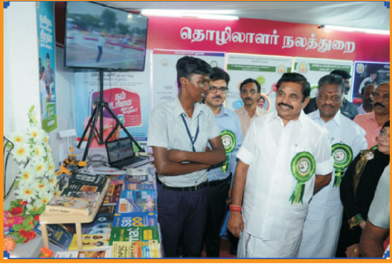
ஓராண்டு சாதனை கண்காட்சி