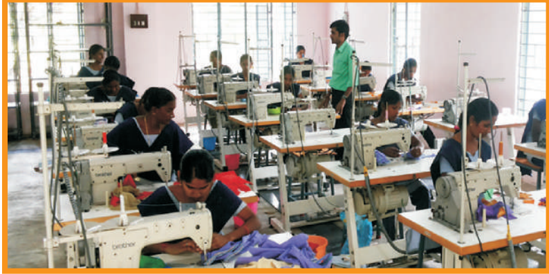
பயிற்சியாளர்களுக்கு தையல் பயிற்சி