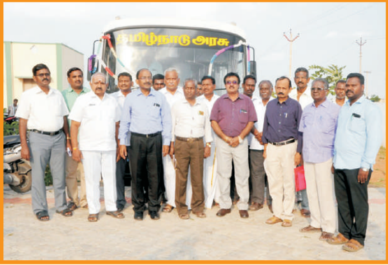
பட்டாசு தொழிற்சாலைகளுக்கான பாதுகாப்பு குறித்த நடமாடும் விழிப்புணர்வு வாகனம்