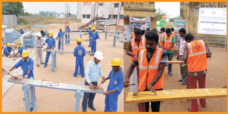
கட்டுமான தொழிலாளர்களுக்கான பயிற்சி