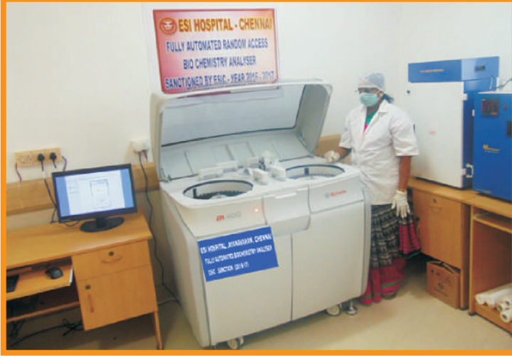
தானியங்கி உயிர்வேதியியல் பகுப்பாய்வு கருவி