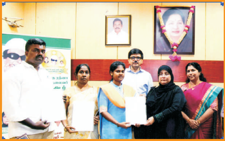
கருணை அடிப்படையில் பணி நியமன ஆணை வழங்குதல்