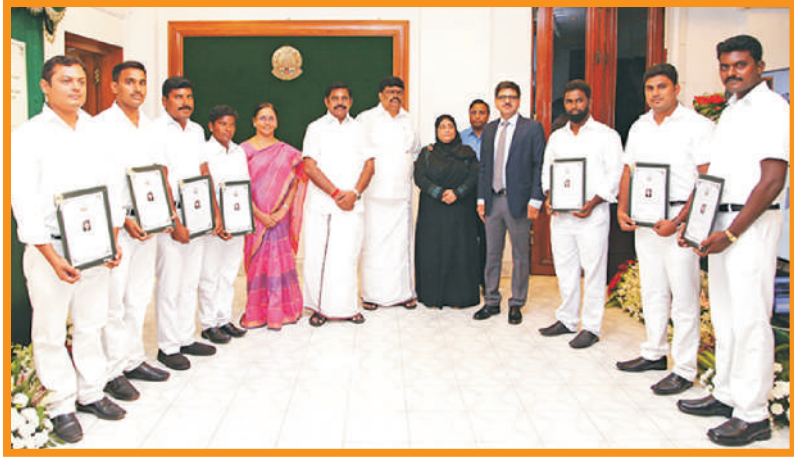
தொழிலாளர் துறையில் ஓட்டுநர்களுக்கு பணிநியமன ஆணை வழங்குதல்