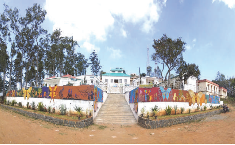
பட்டு சுற்றுலா - "பட்டு உகைம்" ஏற்காடு, சேலம்