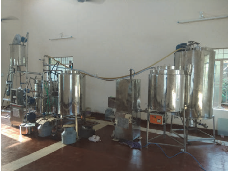
தேன் பதப்படுத்தும் நிலையம், அம்சி, கன்னியாகுமரி மாவட்டம்.