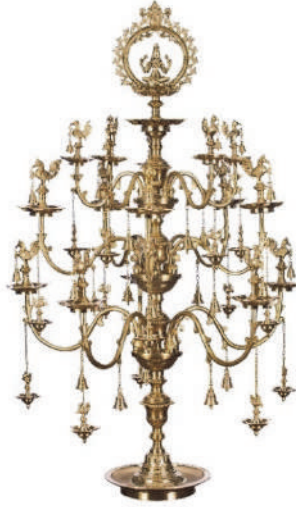
9 அடி பித்தளை கிளை விளக்கு