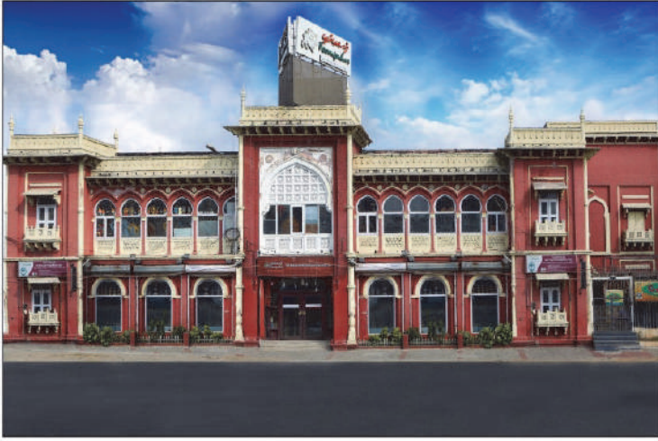
பூம்புகார் விற்பனை நிலையம், சென்னை