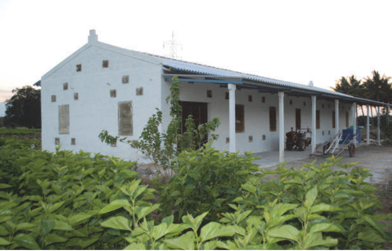
பட்டுப்புழு வளர்ப்பு மனை