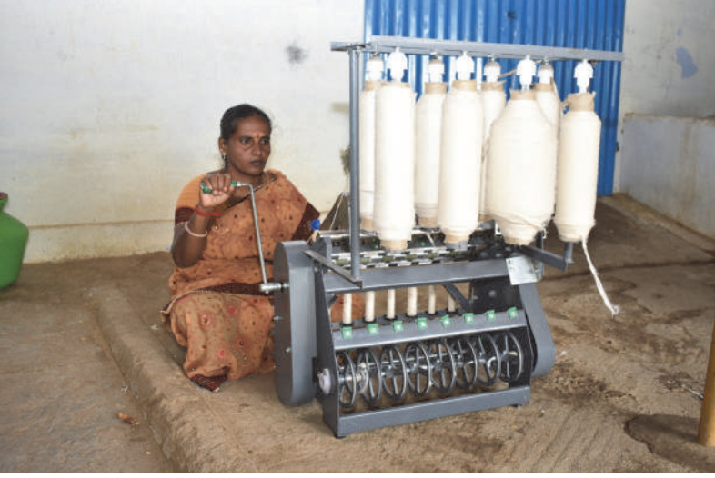
கிராமிய நூற்பு நிலையம் – பூளவாடி, திருப்பூர் மாவட்டம்.