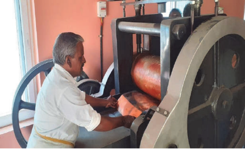
பொது பயன்பாட்டு மையம் - தஞ்சாவூர் கலைத்தட்டு