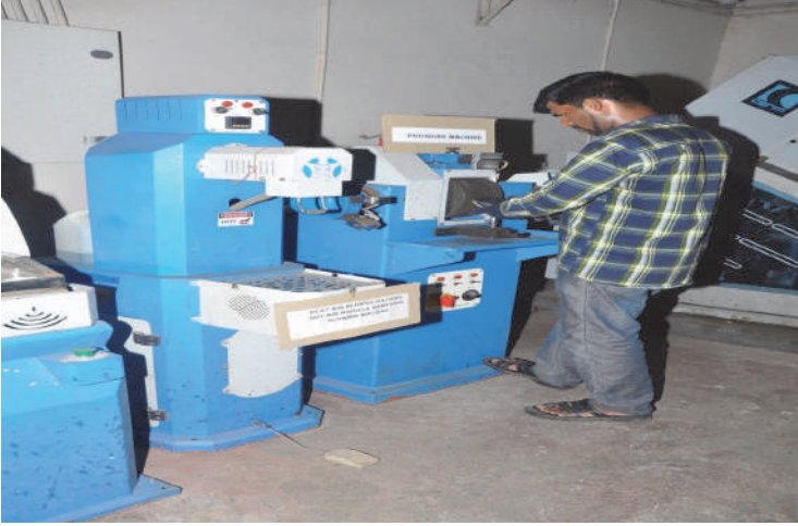
காலணி அலகு, அம்பத்தூர்.