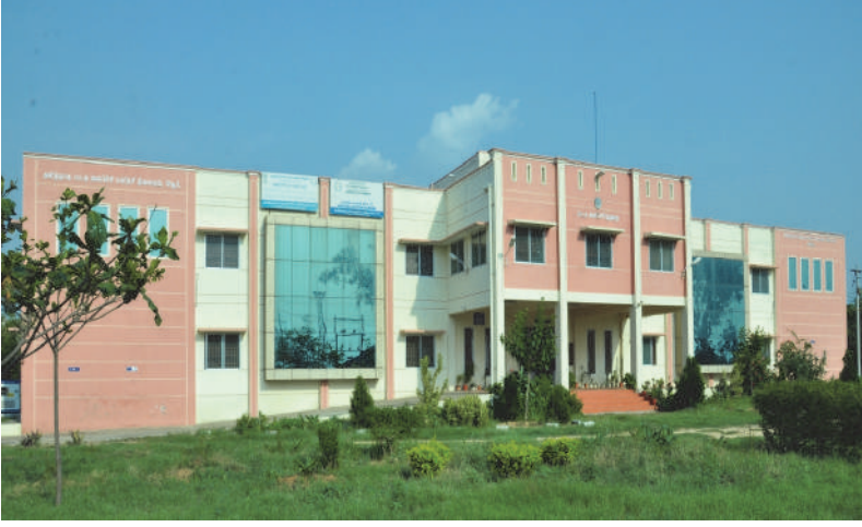
தமிழ்நாடு பட்டுவளர்ச்சி பயிற்சி நிலையம், ஓதூர்