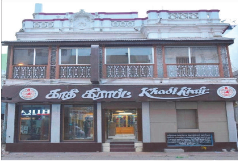
மதுரை மேலமாசி வீதி, கதர் அங்காடி