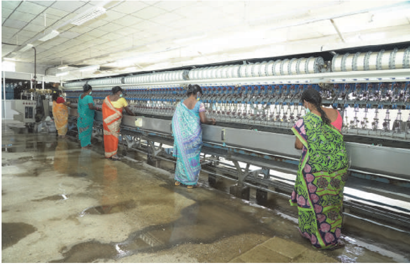
தானியங்கி பட்டு நூற்பு அலகு, அவினாசி