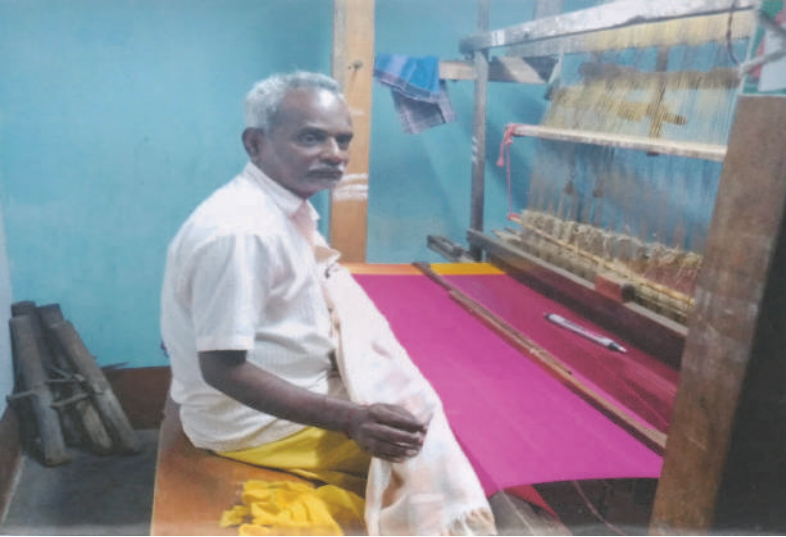
கதர் பட்டு உபகிளை கபிஸ்தலம் – கும்பகோணம்.