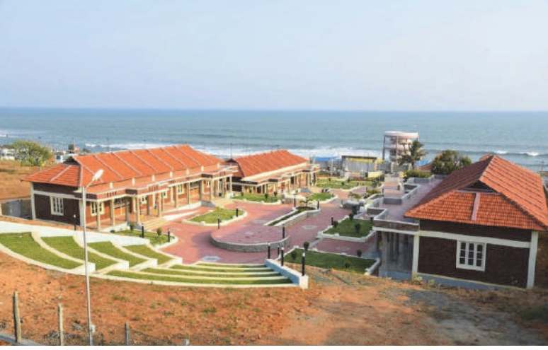
நகர்ப்புற கண்காட்சித் திடல், கன்னியாகுமரி