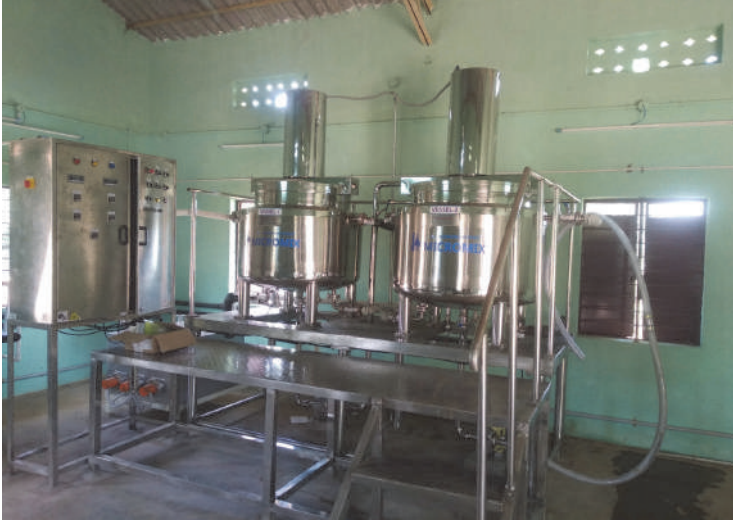
ஷாம்பு மற்றும் கைக்கழுவும் திரவம் தயாரிக்கும் அலகு கண்டனூர்,