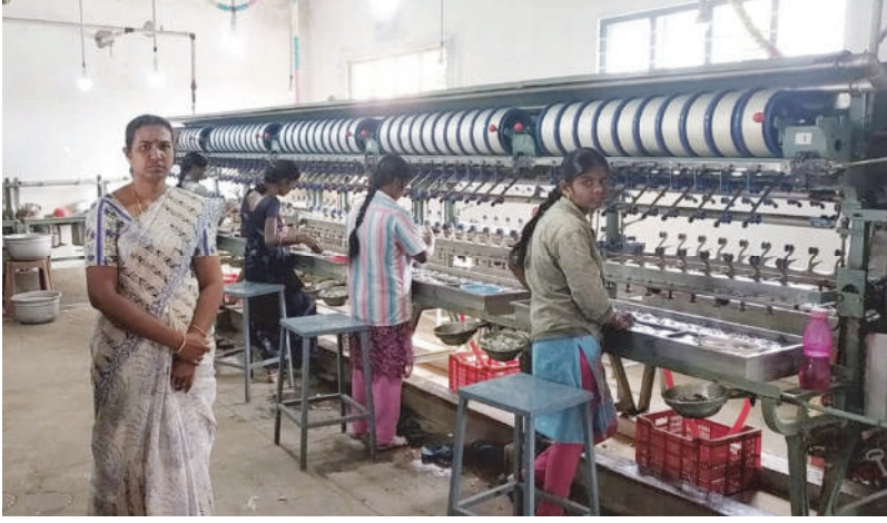
பலமுனை பட்டு நூற்பு அலகு, உடுமலைப்பேட்டை