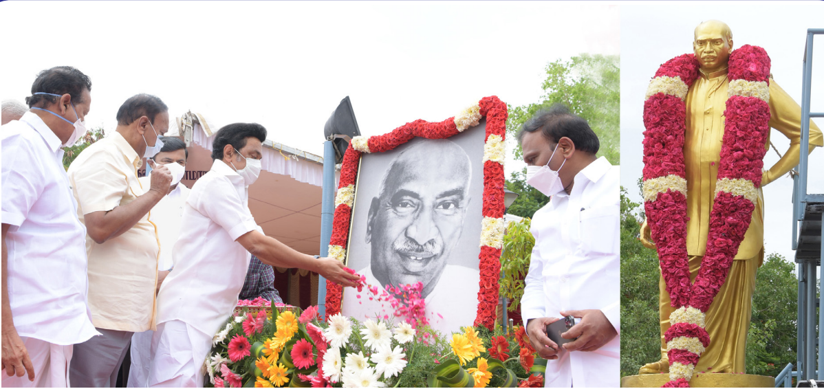
மாண்புமிகு தமிழ்நாடு முதலமைச்சர் திரு. மு.க. ஸ்டாலின் அவர்கள் பெருந்தலைவர் காமராஜர் அவர்களின் திருவுருவப் படத்திற்கு மலர்தூவி மரியாதை (சென்னை, 15.07.2021).