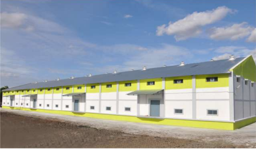
அருப்புக்கோட்டை, விருதுநகர் மாவட்டம்.