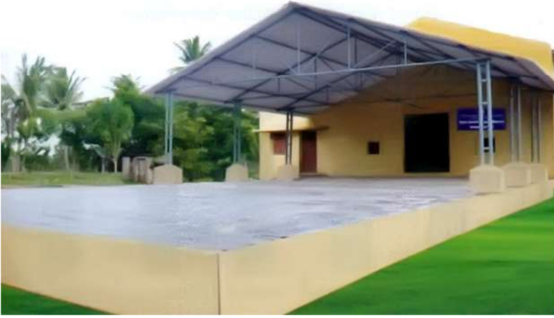
நேரடி ரெல் கொள்முதல் நிலையம் அக்கரை கோட்டகம் கிராமம், திருவாரூர் மாவட்டம்