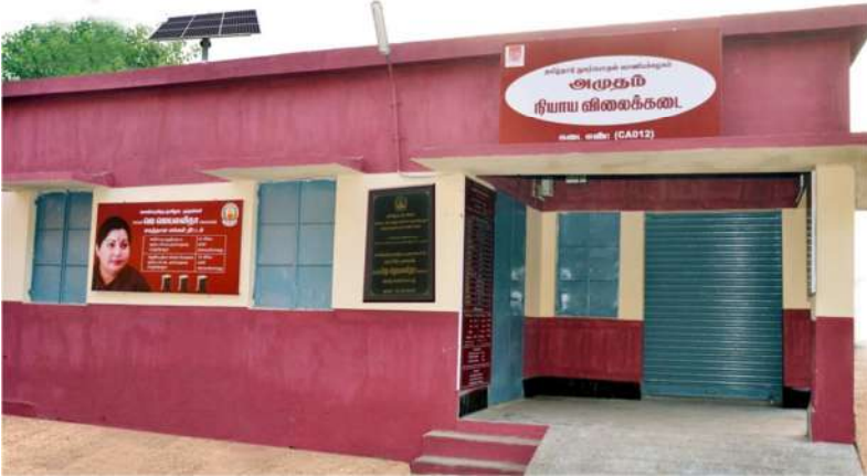
அமுதம் நியாய விலைக் கடை, வியாசர்பாடி, சென்னை