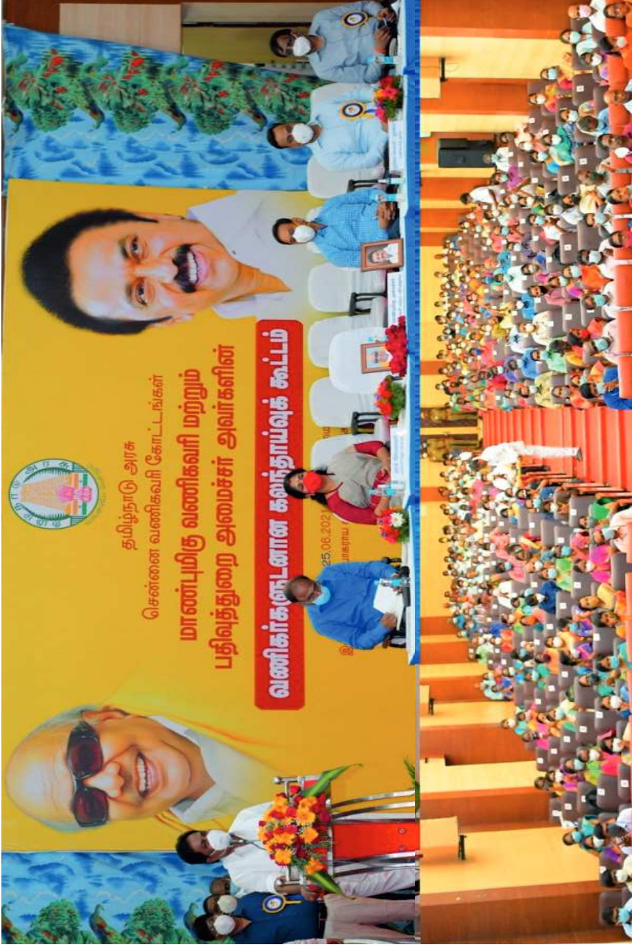
சென்னை மண்டல வணிகர்கள் மற்றும் வணிகர் சங்கங்களுடனான கலந்தாய்வு கூட்டம் இடம் : சென்னை நாள் : 25.06.2021