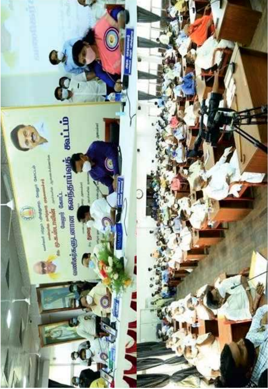
வேளூர் மண்டல வணிகர்கள் மற்றும் வணிகர் சங்கங்களுடனான கலந்தாய்வு கூட்டம் இடம் : வேளூர் நாள் : 01.07.2021