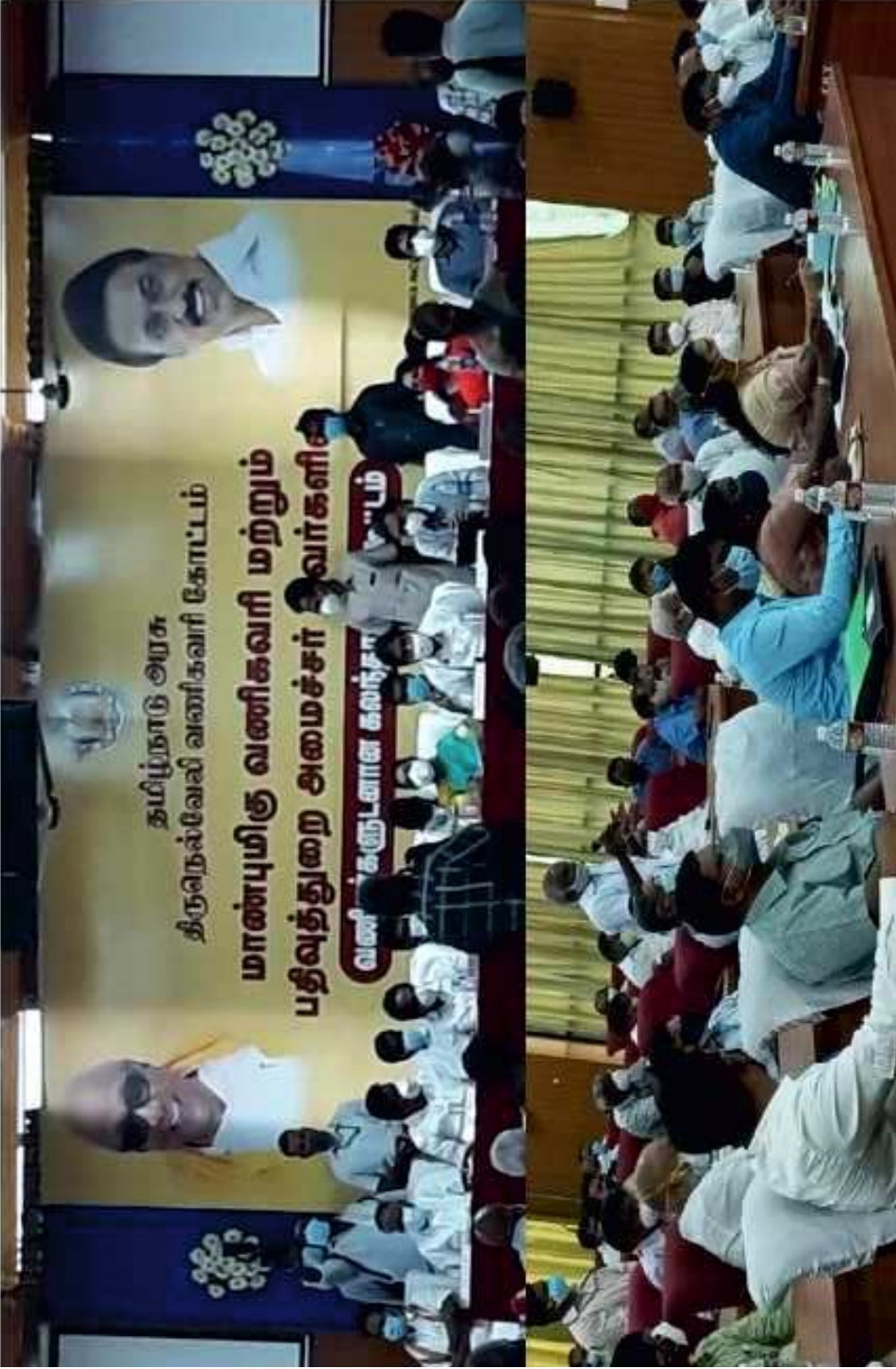
திருநெல்வேலி மண்டல வணிகர்கள் மற்றும் வணிகர் சங்கங்களுடனான கலந்தாய்வு கூட்டம் இடம் : திருநெல்வேலி நாள் : 19.06.2021