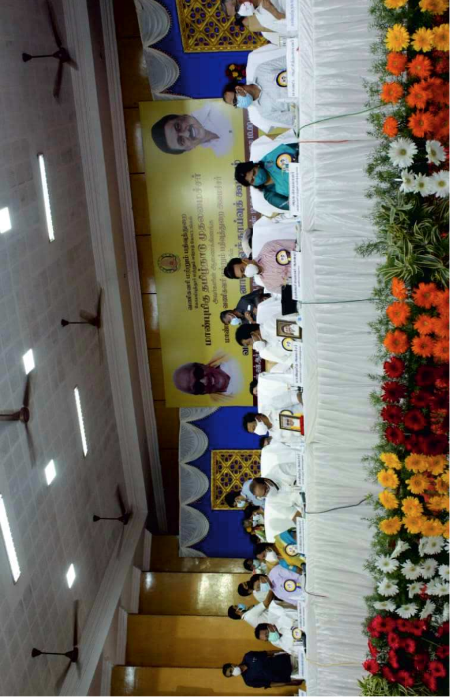
கோயம்புத்தூர் மற்றும் ஈரோடு மண்டலங்களின் வணிகர்கள் மற்றும் வணிகர் சங்கங்களுடனான கலந்தாய்வு கூட்டம் இடம் : கோயம்புத்தூர் நாள் : 12.07.2021