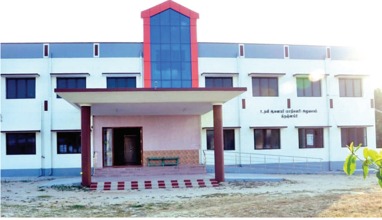
மாண்புமிகு முதலமைச்சர் அவர்களால் திறந்து வைக்கப்பட்ட வணிகவரி அலுவலகக் கட்டடம், கிருஷ்ணகிரி