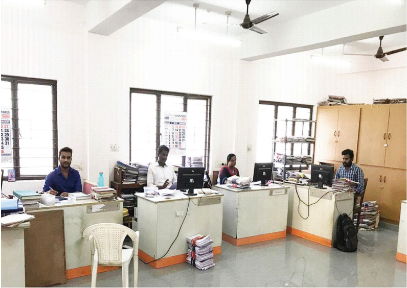
செயல்பாட்டில் உள்ள கிருஷ்ணகிரி வணிகவரி அலுவலகம்