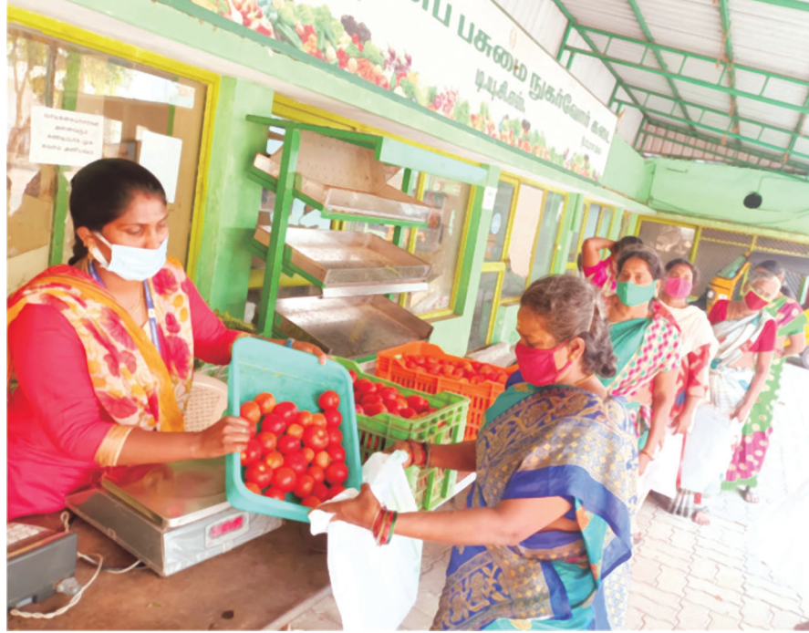
டி.யூ.சி.எஸ். பண்ணைப் பசுமை நுகர்வோர் கடையில் மலிவு விலையில் தக்காளி விற்பனை