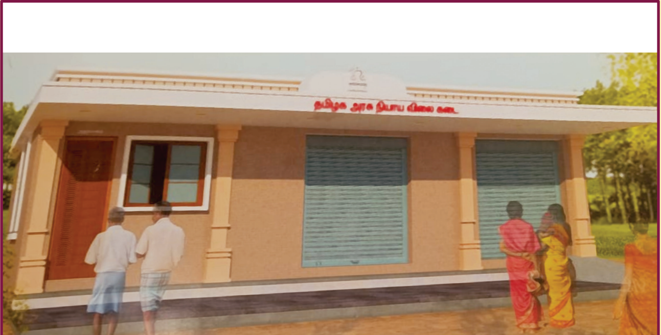
புதியதாக கட்டப்படவுள்ள பொதுவிநியோகத் திட்ட நியாயவிலைக்கடையின் மாதிரி வடிவமைப்பு