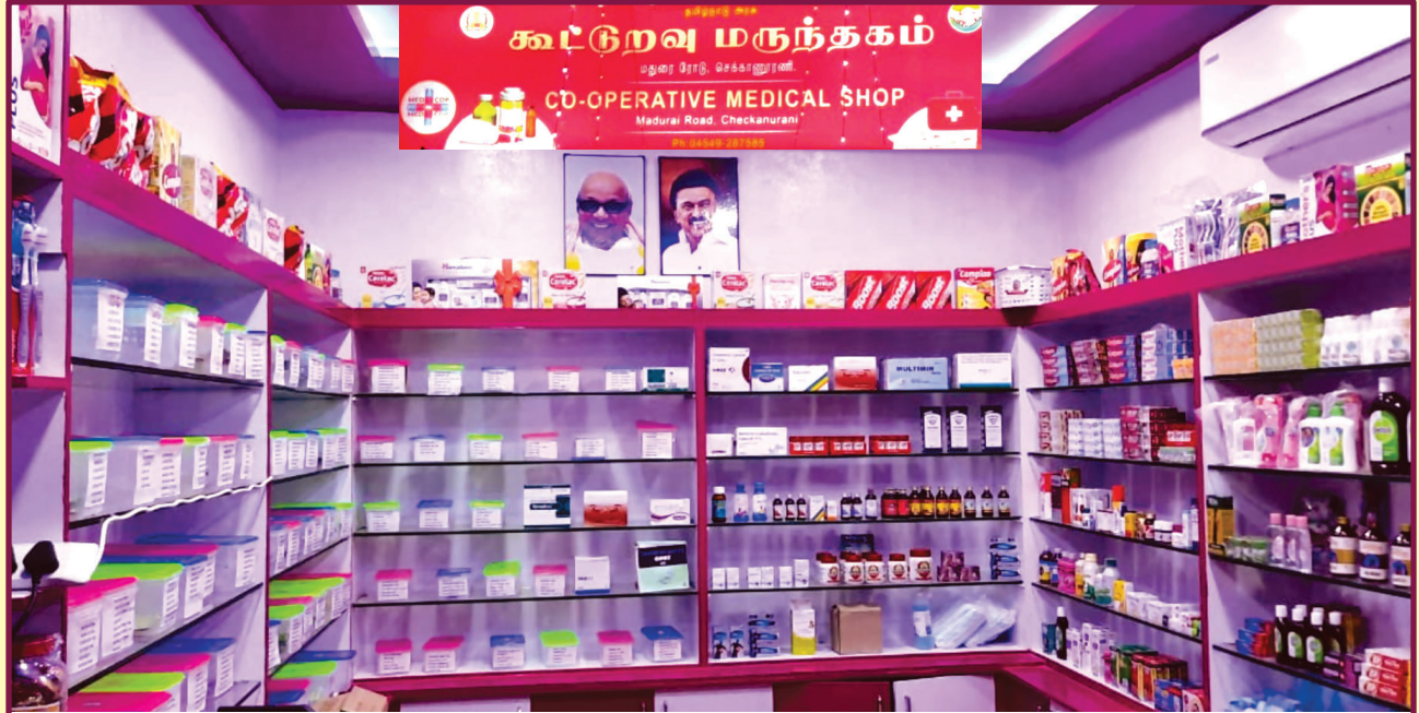
மதுரை மாவட்டம் செக்கானூரணியில் புதியதாக கட்டப்பட்டுள்ள கட்டுறவு மருந்தகம்