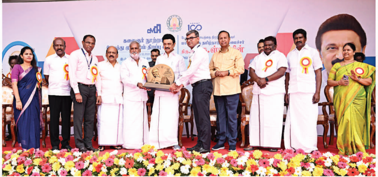
மாண்புமிகு தமிழ்நாடு முதலமைச்சர் அவர்கள் கிளாம்பாக்கத்தில் அமைந்துள்ள “கலைஞர் நூற்றாண்டு பேருந்து முனையத்தினை” 30.12.2023 அன்று திறந்து வைத்தார்கள்