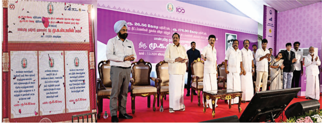
மாண்புமிகு தமிழ்நாடு முதலமைச்சர் அவர்கள் ரூ. 203.76 கோடி மதிப்பிலான நகர்ப்புற வளர்ச்சித் திட்டப்பணிகளுக்கு 07.03.2024 அன்று அடிக்கல் நாட்டினார்கள்