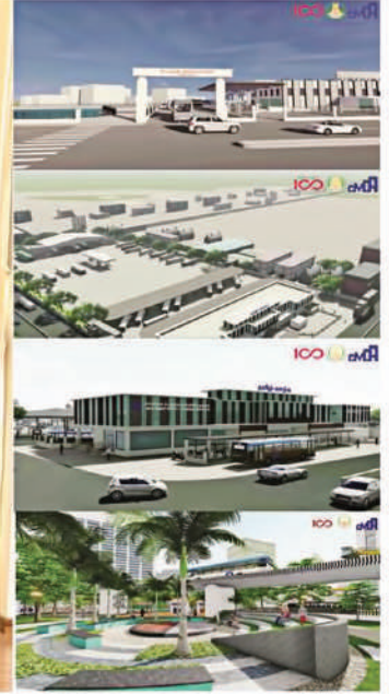
மாண்புமிகு தமிழ்நாடு முதலமைச்சர் அவர்கள் ரூ. 150.05 கோடி மதிப்பிலான நகர்ப்புற வளர்ச்சித் திட்டப்பணிகளுக்கு 15.11.2023 அன்று அடிக்கல் நாட்டினார்கள்