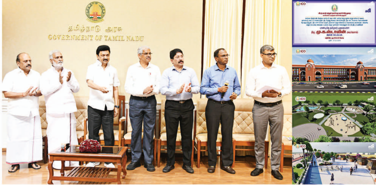
மாண்புமிகு தமிழ்நாடு முதலமைச்சர் அவர்கள் ஞ. 558.45 கோடி மதிப்பிலான நகர்ப்புற வளர்ச்சித் திட்டப்பணிகளுக்கு 27.02.2024 அன்று அடிக்கல் நாட்டினார்கள்