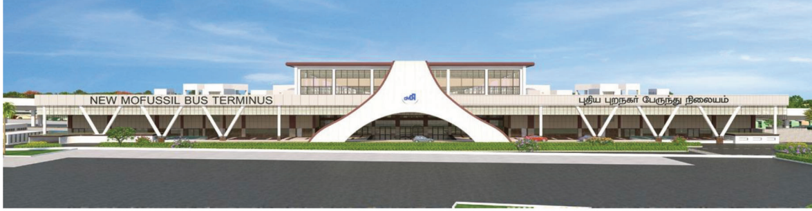
கிளாம்பாக்கம் பேருந்து முனையம் - திட்ட வரைபடம்