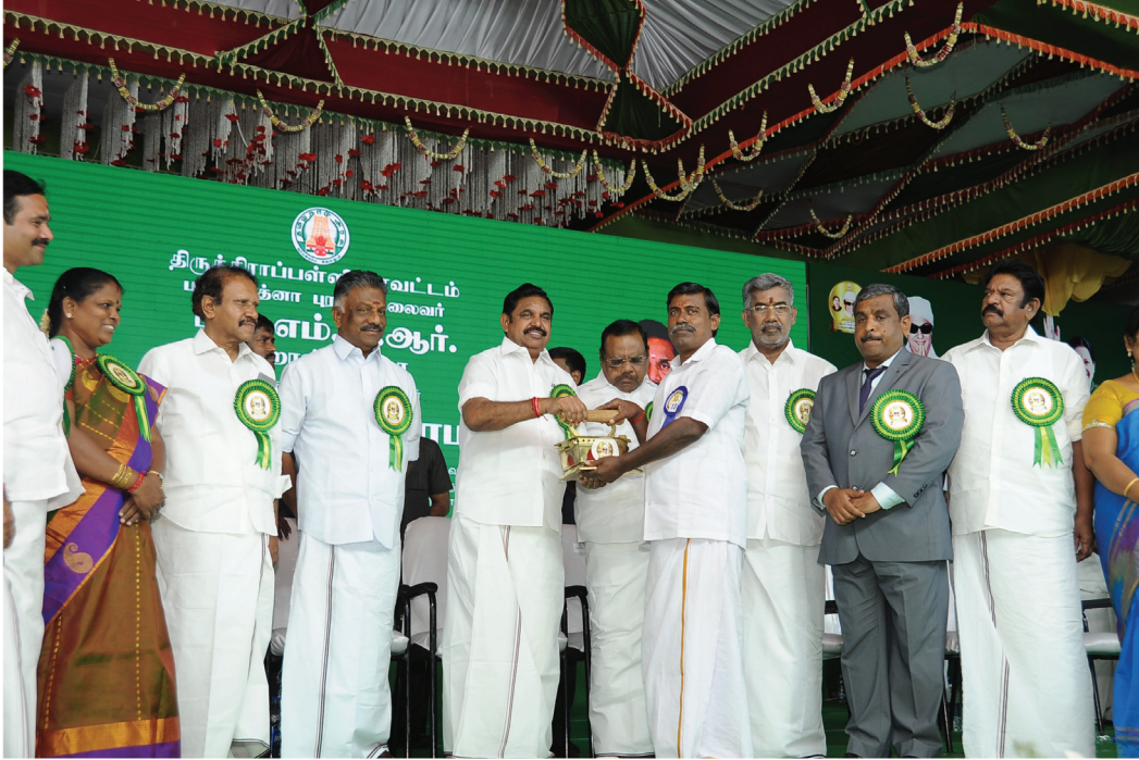
மாண்புமிகு முதலமைச்சர் அவர்கள் விலையில்லா சலவைப் பெட்டிகளை பயனாளிகளுக்கு வழங்கினார்கள்.