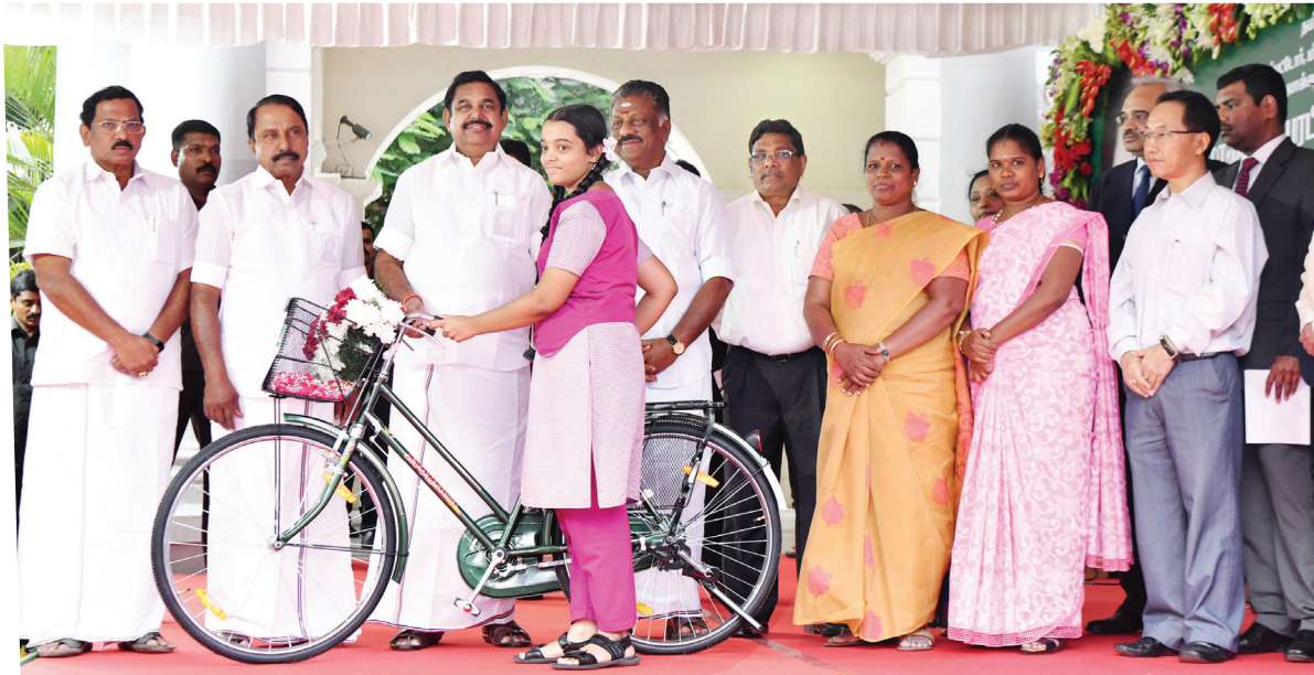
மாண்புமிகு முதலமைச்சர் அவர்கள் 23.12.2019 அன்று மிதிவண்டிகள் வழங்கும் திட்டத்தினை தொடங்கி வைத்தார்கள்.