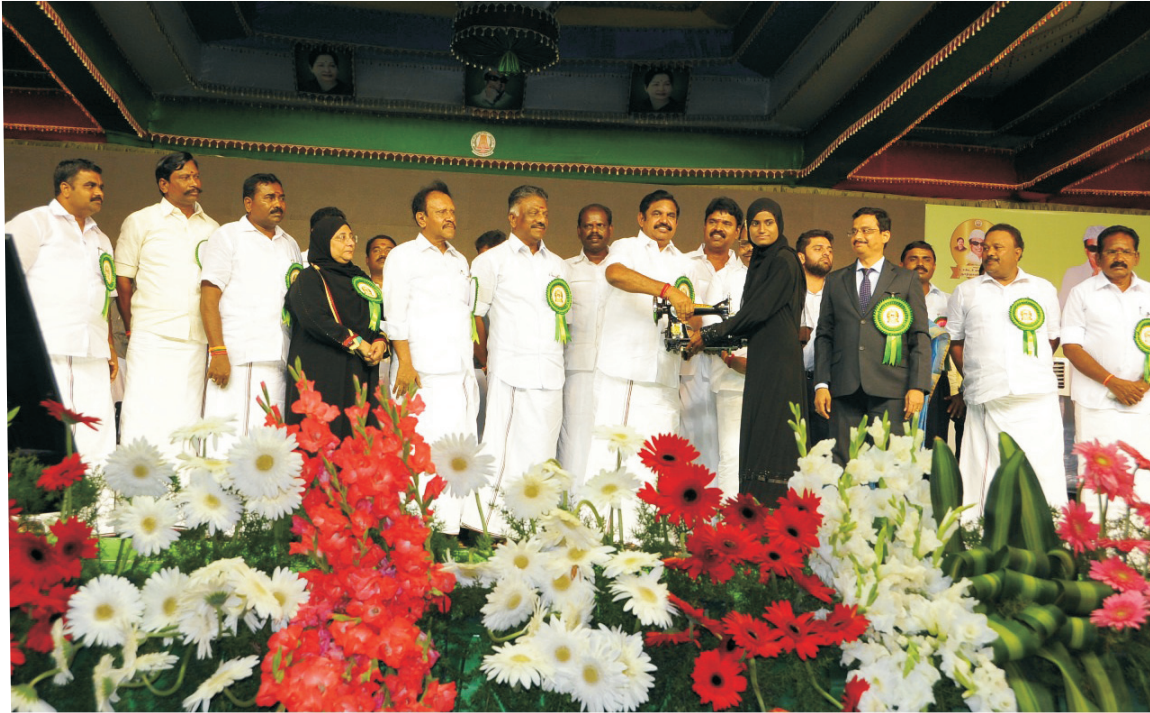
மாண்புமிகு முதலமைச்சர் அவர்கள் விலையில்லா தையல் இயந்திரங்களை பயனாளிகளுக்கு வழங்கினார்கள்.