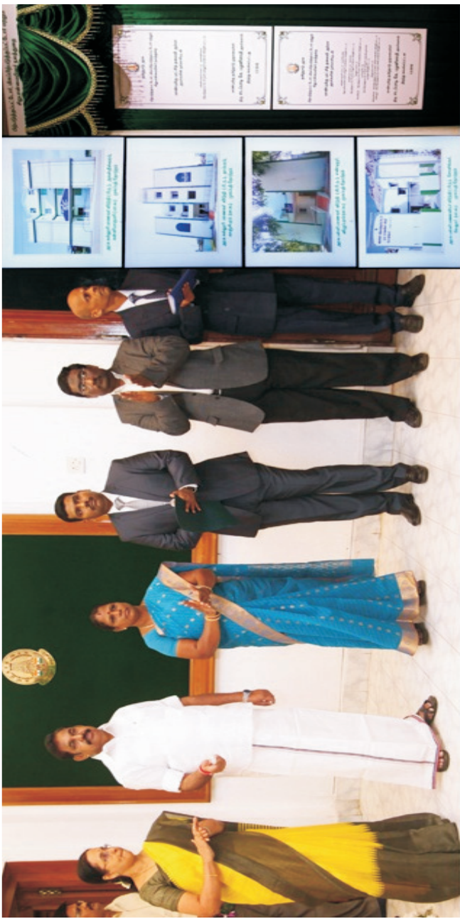
மாண்புமிகு முதலமைச்சர் அவர்கள் 01.03.2018 அன்று புதிதாகக் கட்டப்பட்ட பள்ளி மற்றும் கல்லூரி விடுதிக் கட்டடங்களை திறந்து வைத்தார்கள்.