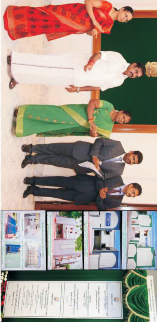
மாண்புமிகு முதலமைச்சர் அலுவலகம் 16.5.2017 அன்று புதிதாகக் கட்டப்பட்ட பள்ளி மற்றும் கல்லூரி விடுதிக் கட்டடங்களை சிறந்து வைத்தார்கள்.