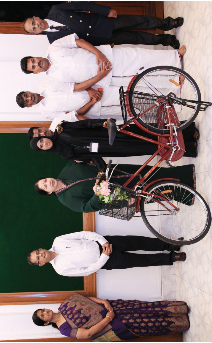
மாண்புமிகு முதலமைச்சர் அவர்கள் 15.07.15 அன்று 2015-16 கல்வியாண்டில் 11ஆம் வகுப்பு பயிலும் மாணவ, மாணவியருக்கு மிதிவண்டிகள் வழங்கும் திட்டத்தை துவக்கி வைத்தார்கள்.