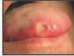
நாக்கில் தடிப்பட்ட புண்