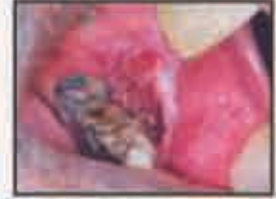
வாயினுள் தடிப்பட்ட புண்