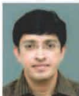
Dr J Radhakrishnan IAS Health Secretary, Tamil Nadu

B ased on vital health indicators, Tamil Nadu is a frontrunner among the various States of India. Tamil Nadu has progressed steadily in the prevention and treatment of chronic diseases.