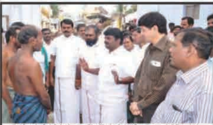
மேற்கண்ட விவரம்: அமைச்சர் உட்படி சி.வி.பாபுவாங்கி வாரியத்தின்... [Caption text describing the image]